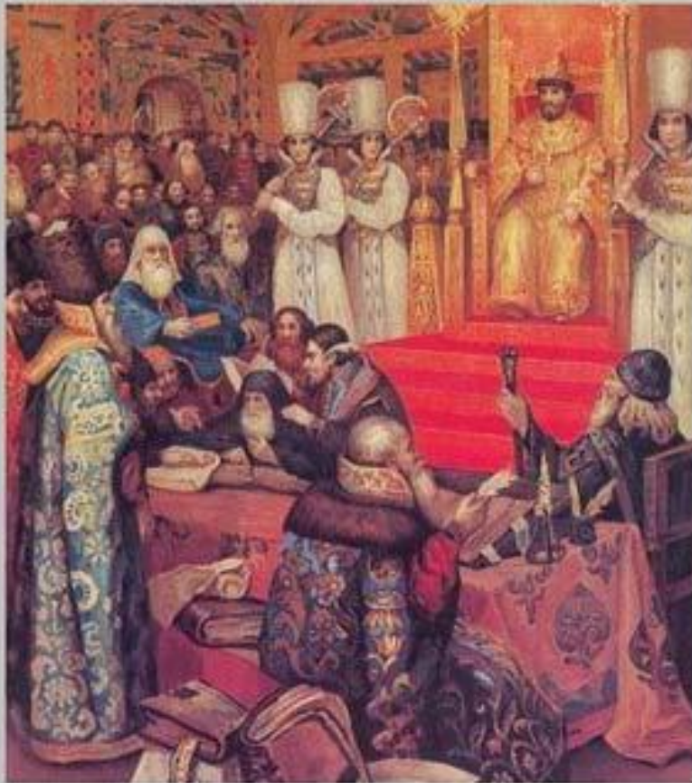
Н.Ф.Некрасов Составление Соборного Уложения при царе Алексее Михайловиче. 1649 г.