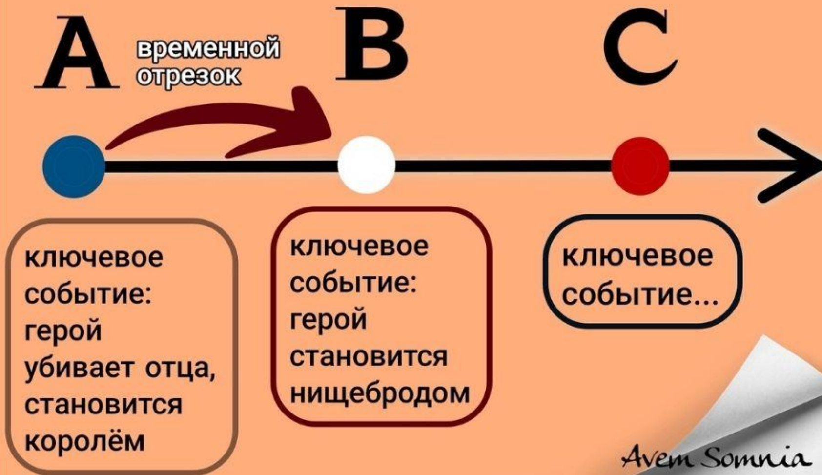
Схема построения сюжета