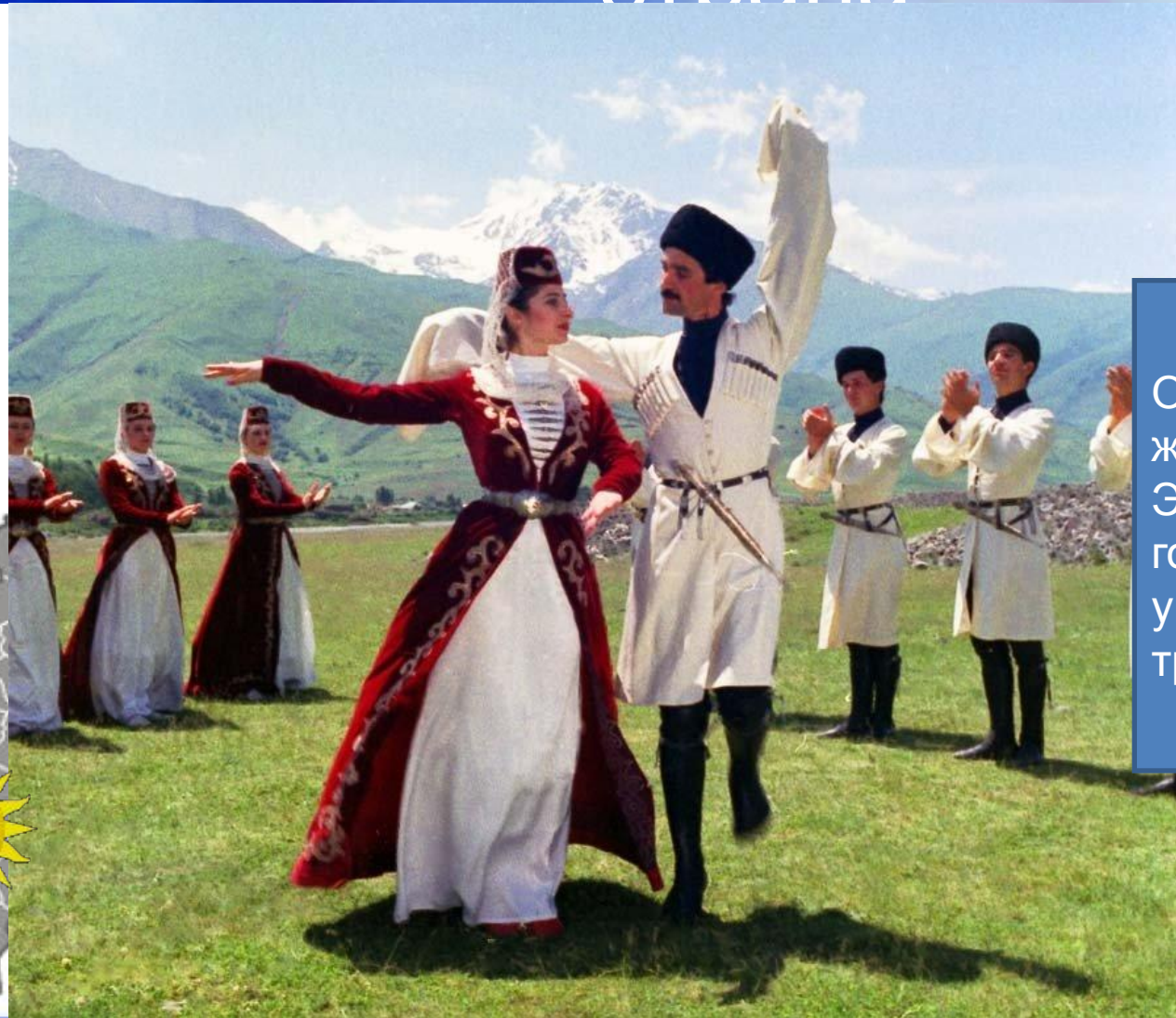
Республика Северная Осетия - Алания