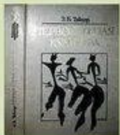
Э. Тайлор, 1871 г. «Первобытная культура».

Сложная целостность, слагаемая «из знаний, верований, искусства, нравственности, законов, обычаев и некоторых других способностей и привычек, усвоенных человеком как членом общества».