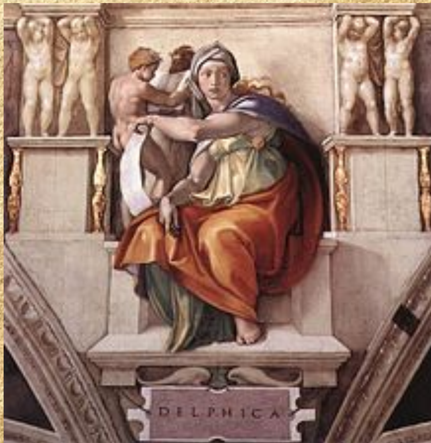
Дельфийская сивилла (пифия).

оракул, то есть прорицалище, при храме Аполлона в Дельфах. Согласно греческой мифологии был основан самим Аполлоном на месте его победы над чудовищным змеем Пифоном. Дельфийский оракул, которым заведовала жрица (пифия), был одним из главных прорицалищ в эллинском мире.