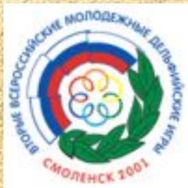
II (2001, Смоленск)