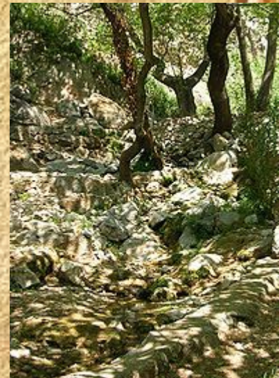
Кастальский источник у подножья горы Парнас в Дельфах

История Пифийских игр достаточно отчётливо документируется с 582 года до н. э., когда после первой Священной войны около 586 года до н. э. управление Играми перешло к Дельфийской Амфикистии — совету двенадцати греческих племён. С тех пор Пифийские игры стали проходить каждые четыре года, в год, предшествующий Олимпийским играм.