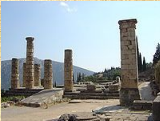
Руины храма Аполлона, в честь которого проводились Пифийские игры