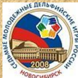
VII (2008, Новосибирск)