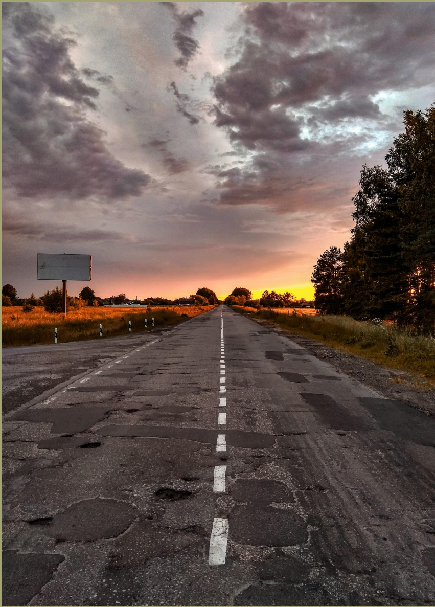
И ю н ь 2020