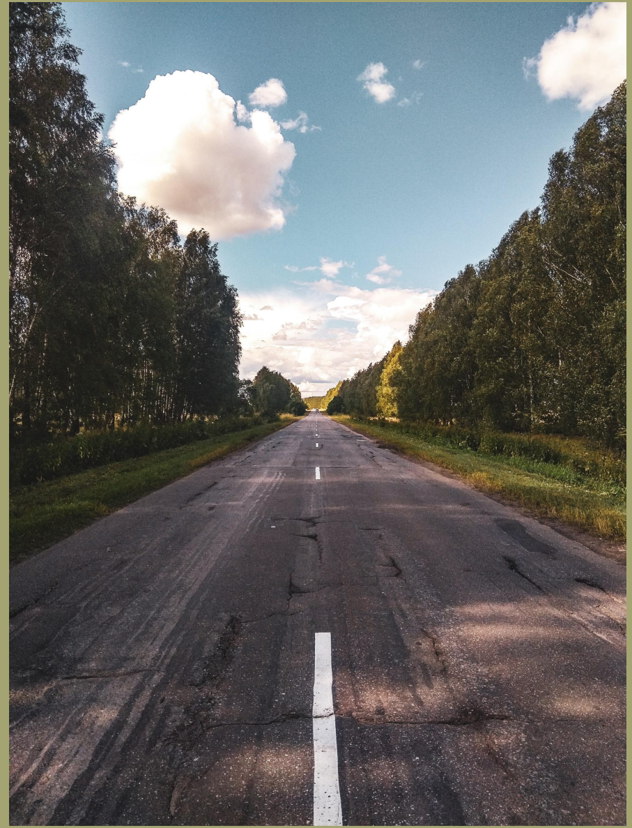
И ю л ь 2020