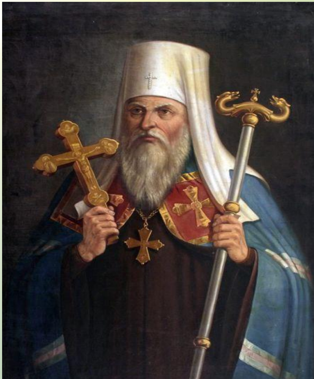
Митрополит Сибирский и Тобольский, Филофей Лещинский