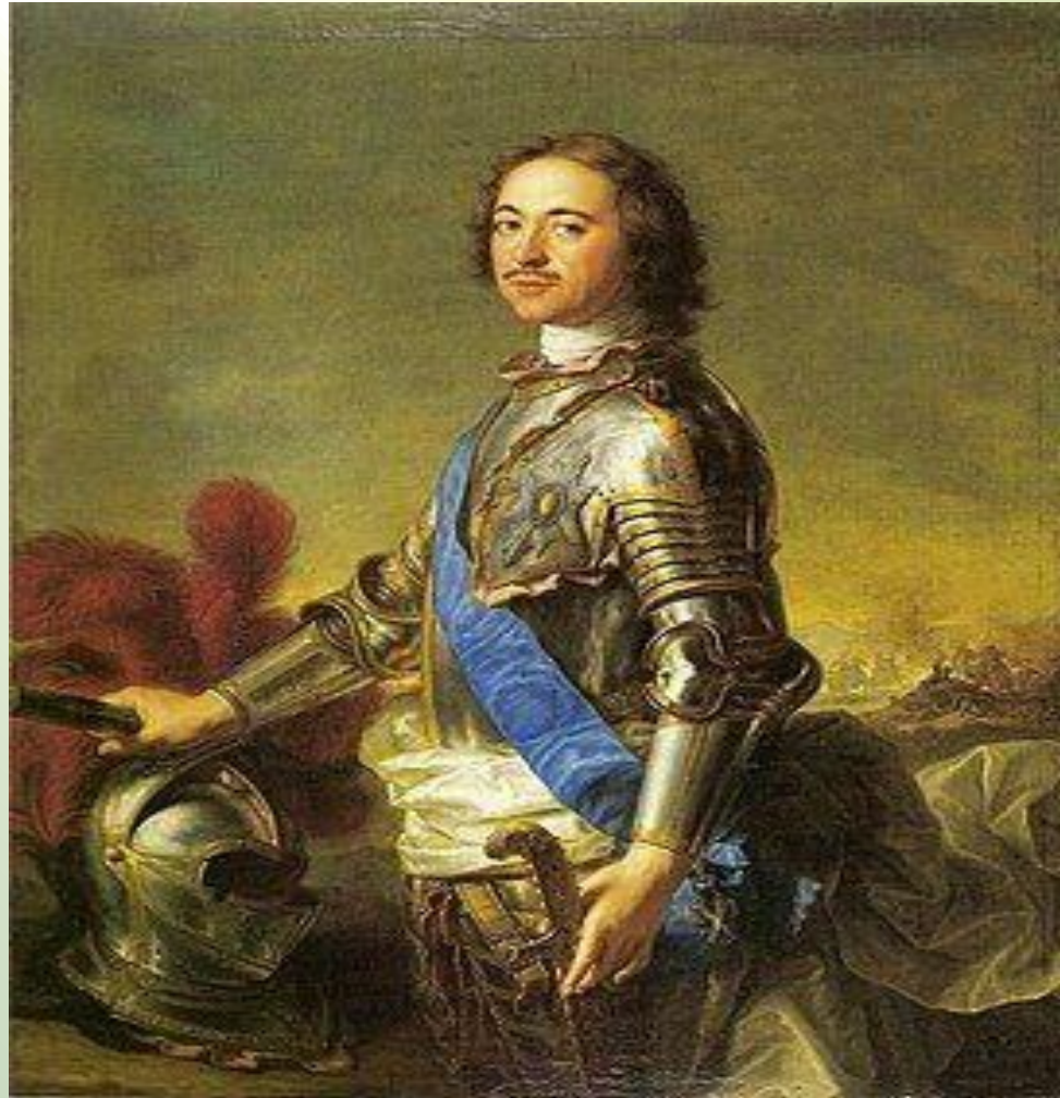
Первый Император Всероссийский, Романов Петр I Алексеевич

Портрет Петра I кисти Жана—Марка Натье, 1717 г.