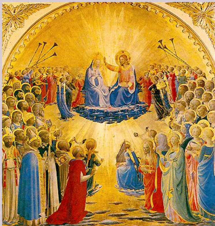
Анджелико. «Коронование святой девы».