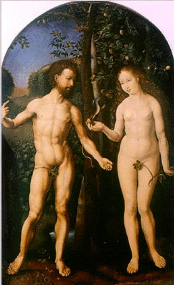
Ян Госсарт. «Адам и Ева». 1508 г.