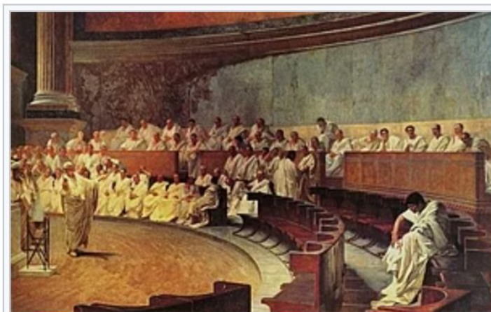
Чезаре Маккари. «Цицерон разоблачает Катилину» (1888).

Ораторское искусство и свойства ораторской речи изучает наука риторика .