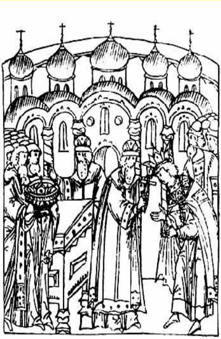
Венчание Ивана IV на царство