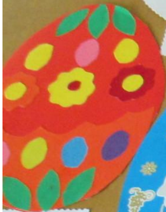
Почемучка «Тюмень» Аппликация «Пасхальное яйцо» Материалы: бумага, клей, ножницы МБУ ДОУ «Детский сад №10»