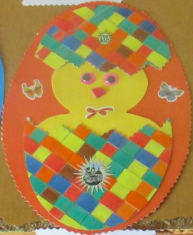
Почемучка «Тюмень» Аппликация «Пасхальное яйцо» Материалы: бумага, клей, ножницы МБУ ДОУ «Детский сад №10»