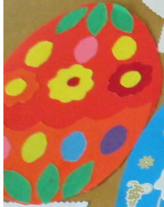
Почемучка «Тюмень» Аппликация «Пасхальное яйцо» Материалы: бумага, клей, ножницы МБУ ДОУ «Детский сад №10»