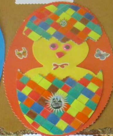
Почемучка «Тюмень» Аппликация «Пасхальное яйцо» Материалы: бумага, клей, ножницы МБУ ДОУ «Детский сад №10»