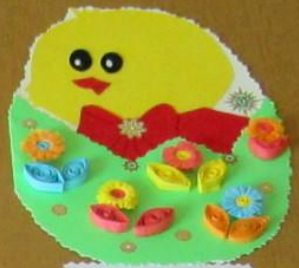
Почемучка «Тюмень» Аппликация «Пасхальное яйцо» Материалы: бумага, клей, ножницы МБУ ДОУ «Детский сад №10»