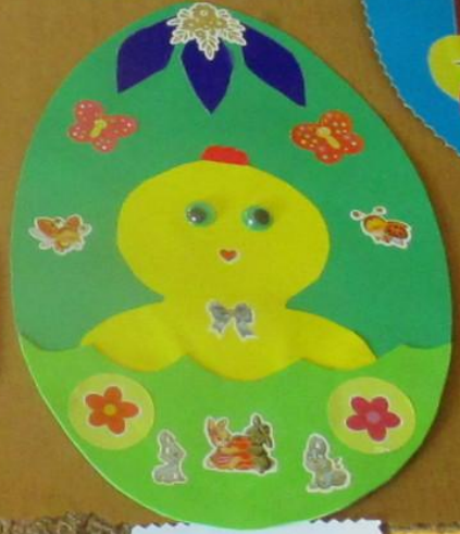
Почемучка «Тюмень» Аппликация «Пасхальное яйцо» Материалы: бумага, клей, ножницы МБУ ДОУ «Детский сад №10»