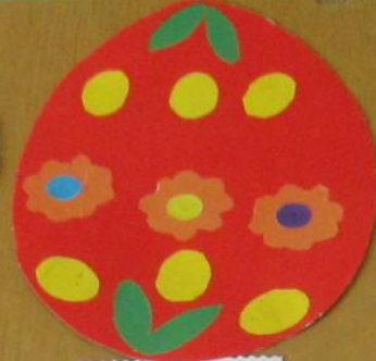
Почемучка «Тюмень» Аппликация «Пасхальное яйцо» Материалы: бумага, клей, ножницы МБУ ДОУ «Детский сад №10»