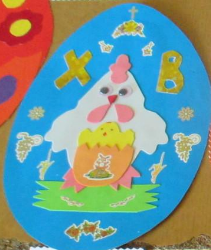
Почемучка «Тюмень» Аппликация «Пасхальное яйцо» Материалы: бумага, клей, ножницы МБУ ДОУ «Детский сад №10»