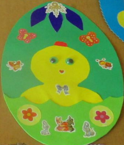
Почемучка «Тюмень» Аппликация «Пасхальное яйцо» Материалы: бумага, клей, ножницы МБУ ДОУ «Детский сад №10»