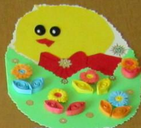
Почемучка «Тюмень» Аппликация «Пасхальное яйцо» Материалы: бумага, клей, ножницы МБУ ДОУ «Детский сад №10»