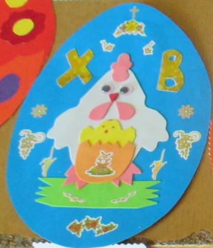
Почемучка «Тюмень» Аппликация «Пасхальное яйцо» Материалы: бумага, клей, ножницы МБУ ДОУ «Детский сад №10»