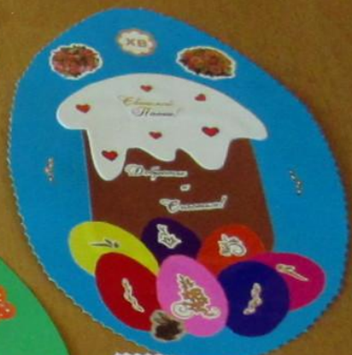
Почемучка «Тюмень» Аппликация «Пасхальное яйцо» Материалы: бумага, клей, ножницы МБУ ДОУ «Детский сад №10»