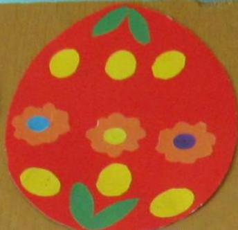
Почемучка «Тюмень» Аппликация «Пасхальное яйцо» Материалы: бумага, клей, ножницы МБУ ДОУ «Детский сад №10»