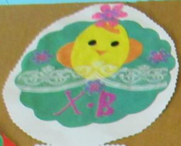
Почемучка «Тюмень» Аппликация «Пасхальное яйцо» Материалы: бумага, клей, ножницы МБУ ДОУ «Детский сад №10»