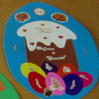
Почемучка «Тюмень» Аппликация «Пасхальное яйцо» Материалы: бумага, клей, ножницы МБУ ДОУ «Детский сад №10»