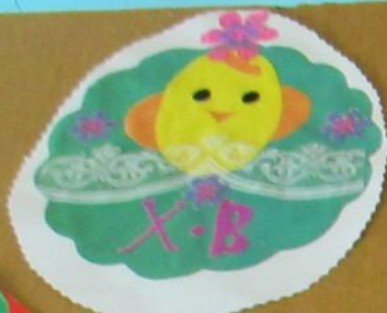
Почемучка «Тюмень» Аппликация «Пасхальное яйцо» Материалы: бумага, клей, ножницы МБУ ДОУ «Детский сад №10»