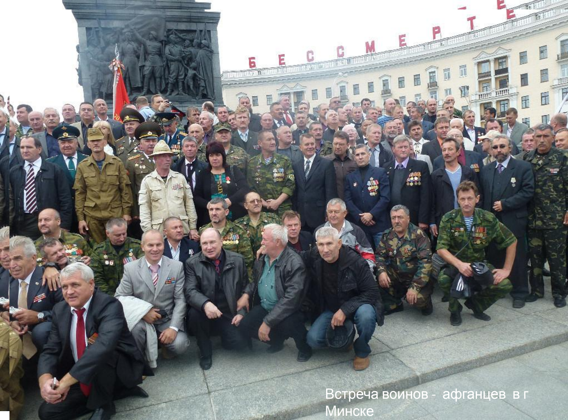
Встреча воинов - афганцев в г Минске