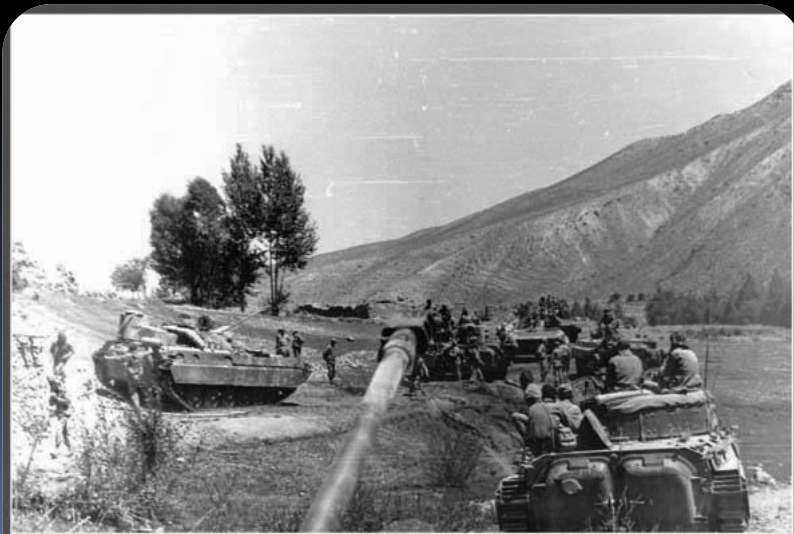
Афганистан, провинция Тур, г. Чагчаран 1985г. ▲▼

Осень — функции 40-й армии сводятся к прикрытию южных границ СССР, для чего привлекаются новые мотострелковые подразделения. Началось создание опорных базовых районов в труднодоступных местах страны.