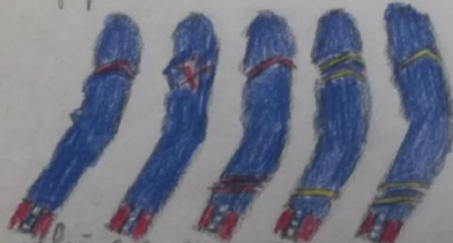
Императорский и Императорский полк Сен-Жермен Кавалерийский Сардинский Стрелковый Сардинский