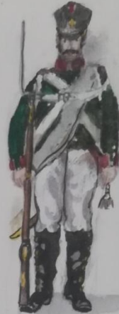
Гренадер - офицер артиллерии (в зимней форме)

История гренадер в русской армии существовала с 1716 по 1917 годов. Они играли в армии очень важную роль.