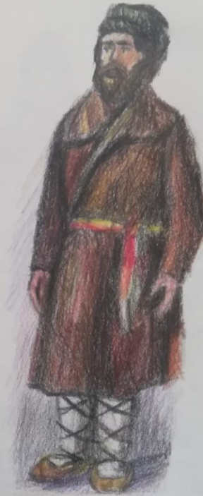
Повседневная одежда крестьян. XVIII век. (до 1816г.).