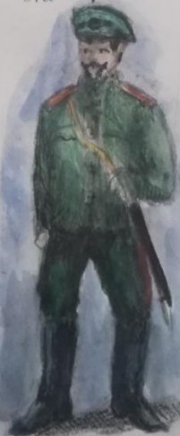
Обер-офицер. Летняя обшитая форма вне лагерного расположения.

Обер-офицерам штормов палатки если они следуют верхом, при передвижении, маневрах и походах.