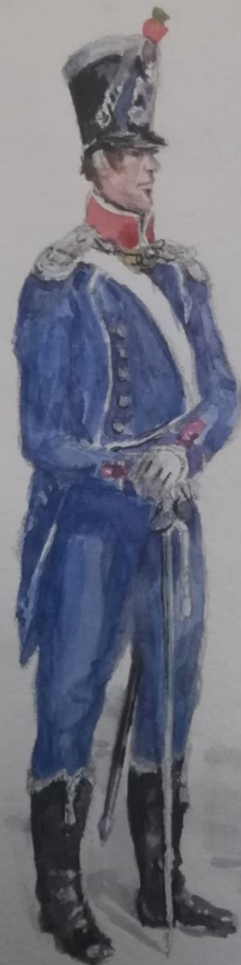
Лейтенант лёгкого полка (парадная форма).