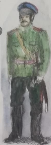
Обер-офицер. Летняя передняя форма вне строя.