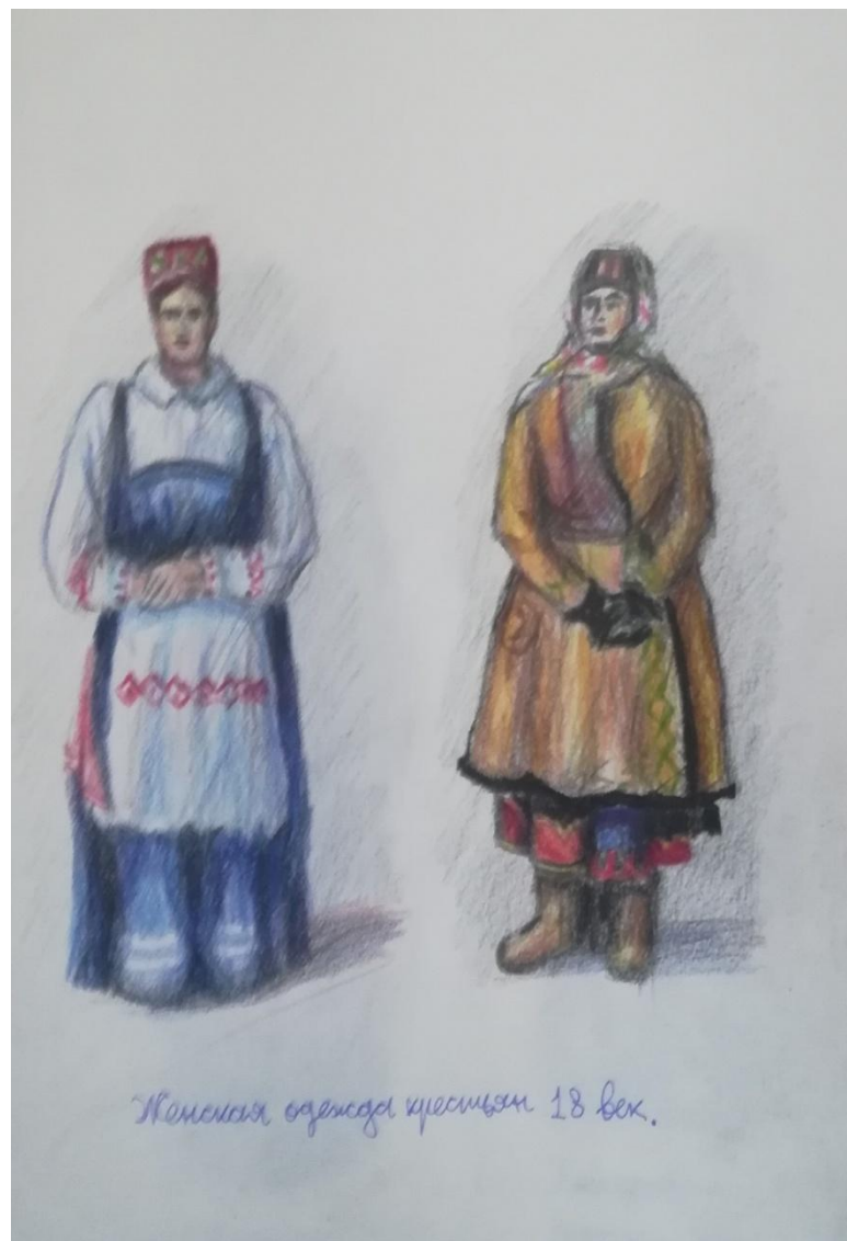
Женская одежда крестьян 18 век.