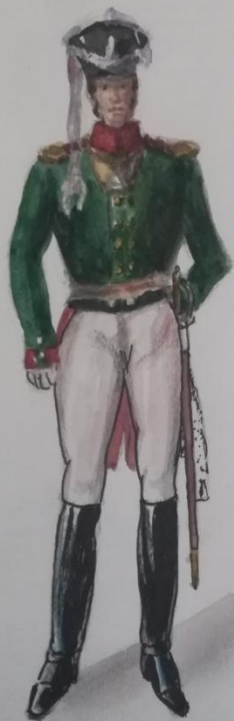
Обер-офицер Орловского пехотного полка в парадной форме. (1812-1814г.г.)

Офицеры русской пехоты, армии Александра I и Михаила Романова. XIX век.