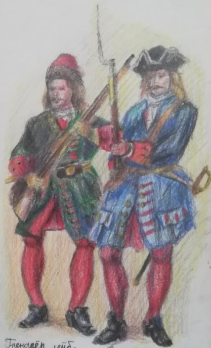
Гренадер лейб-гвардии Цесаревичского полка.