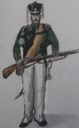
Гренадер - офицер пехоты

Именно на них возлагалась обя- занность воспитания и обуче- ния личного состава. В боевой обстановке они часто занимали выдвинутое положение. К тому же они отличались высокой дисциплиной и выносливостью.