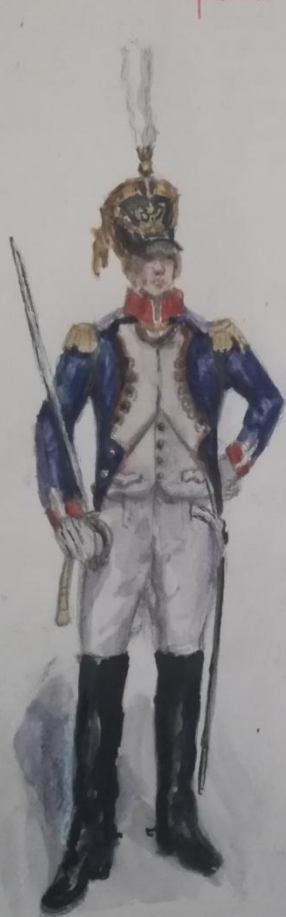
Майор линейного полка (парадная форма).

Офицеры французской пехоты армии Наполеона. XIX век.