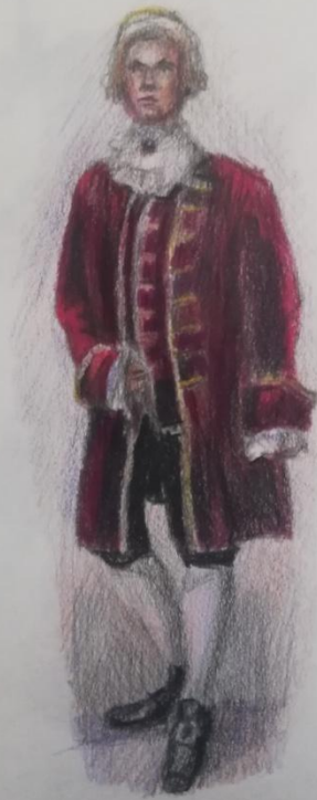
Главный казначей мужской (шелковой) с париками. Россия XVIII век. Моде француз и высшего сословия.