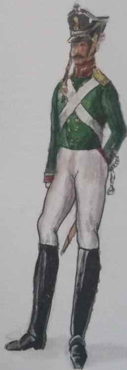
Унтер-офицер пехотного полка в зимней парадной форме. (1812-1814г.г.)