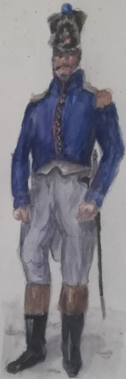
Капитан линейного полка (походная форма)

Линейная пехота - это тяжёлая пехота составлявшая основу сухопутных армий с середины XVII до середины XIX века. Линейная пехота также являлась основой российской армии. Применялась для выполнения особо важных задач: для атаки крепостей и других укрепленных пунктов.