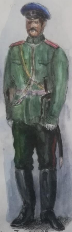
Штаб-офицер. Летняя передняя форма строевая.