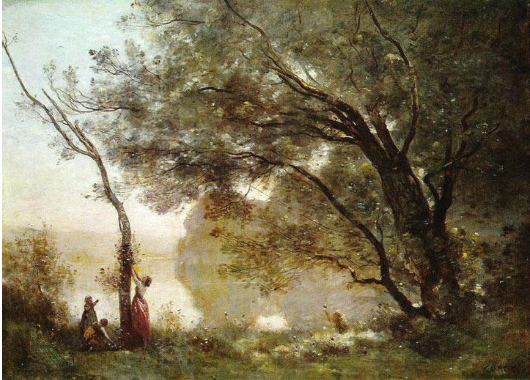
"Воспоминание о Мортefonтене" (1864)