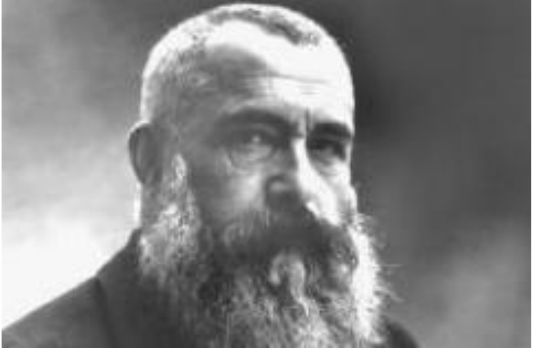
Теодор Руссо (1812-1867) - глава барбизонской школы.