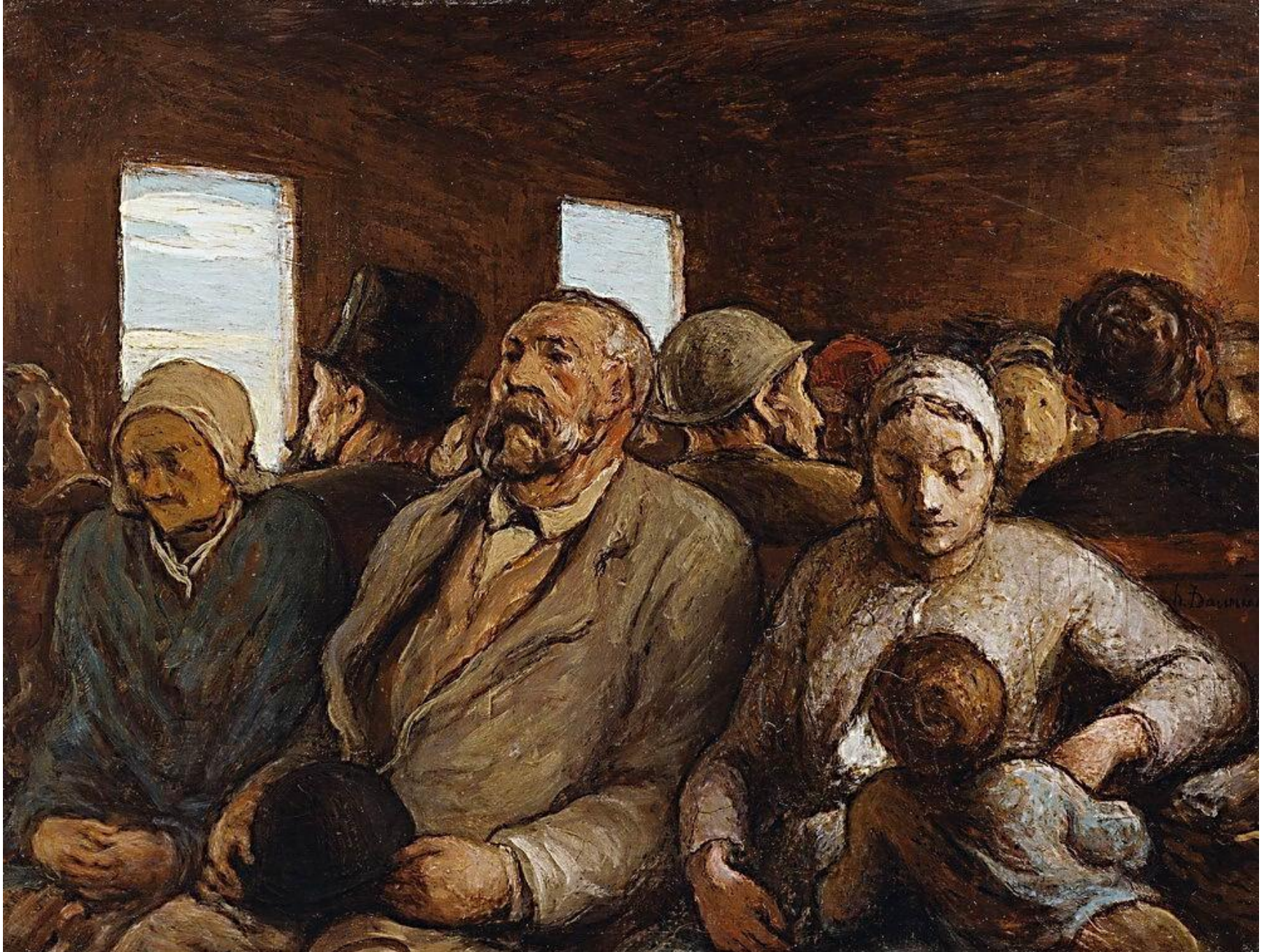
"Вагон третьего класса"