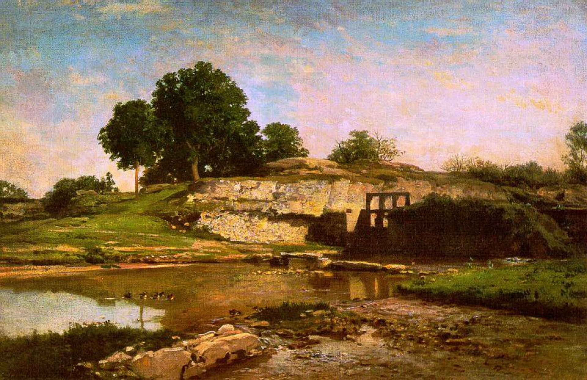
Шарль Добиньи "Запруда в Оптево"