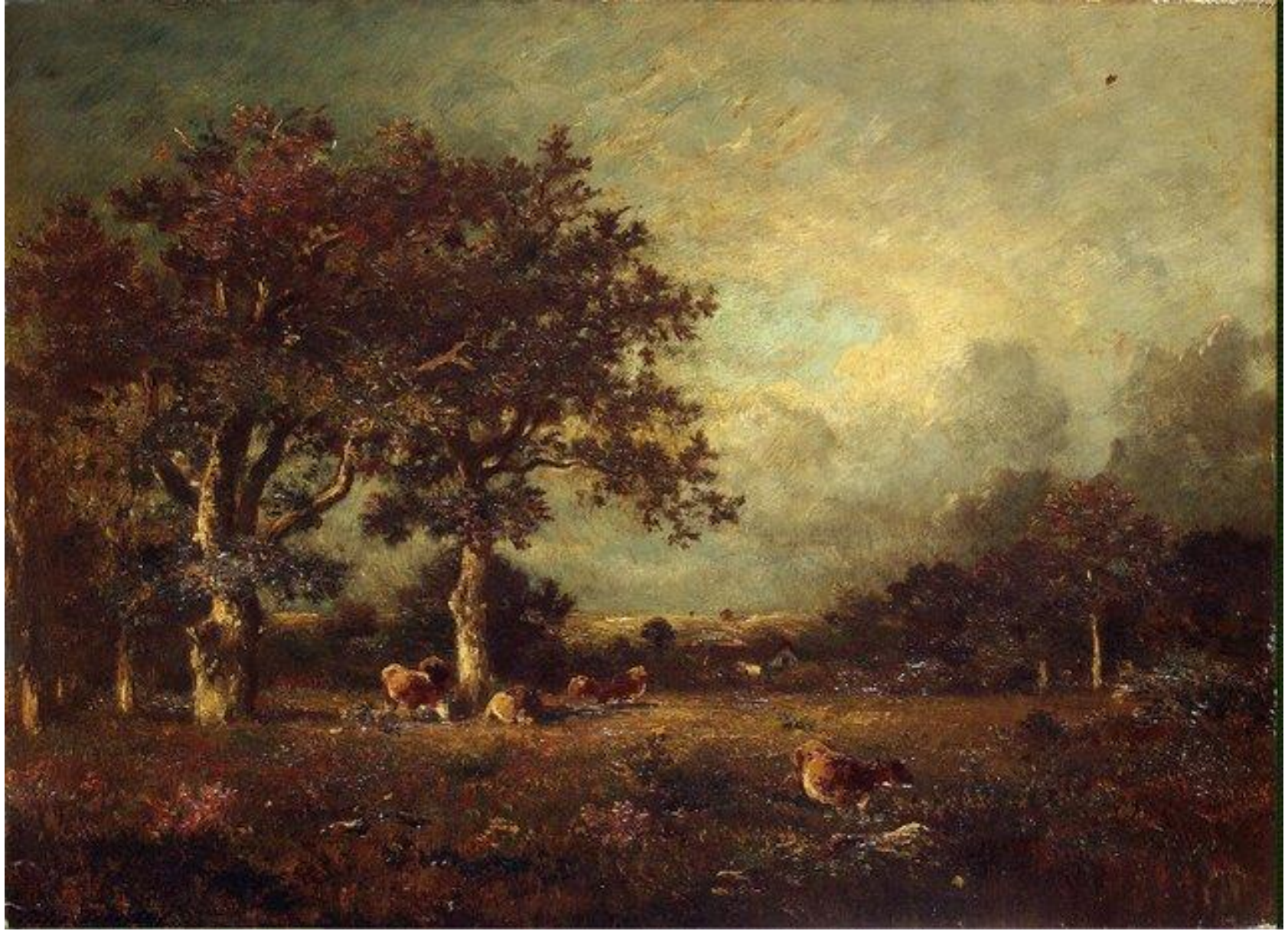
Жюль Дюпре (1811-1889). "Лесной пейзаж"