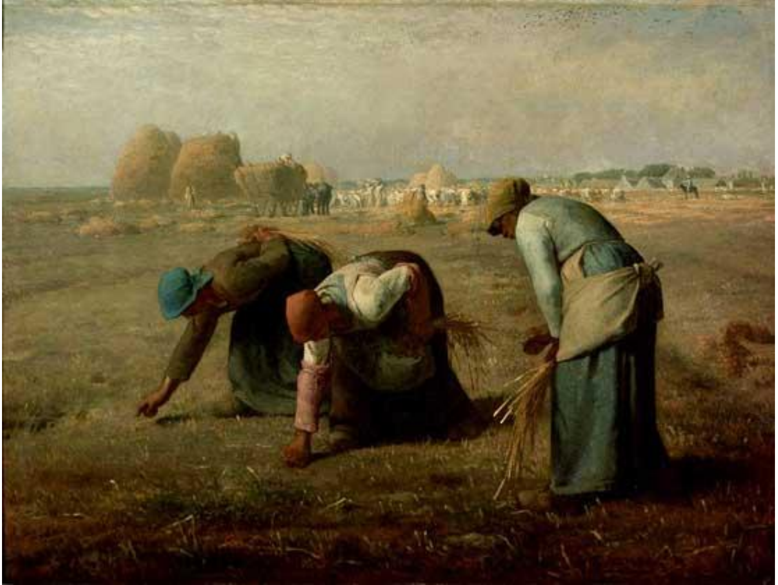
Жан Франсуа Милле (1814-1875). "Сборщицы колосьев"