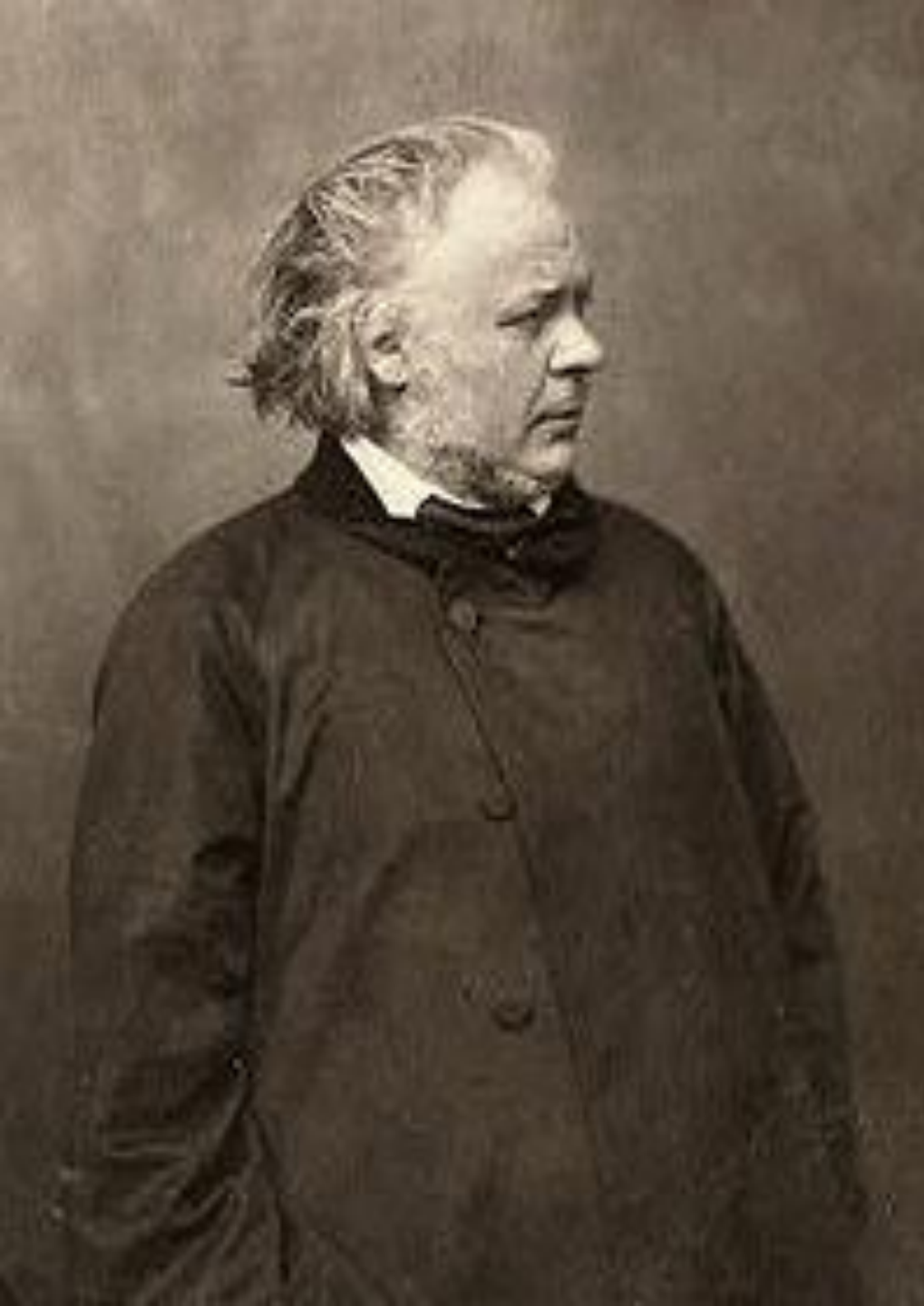
Оноре Домье (1808-1879)