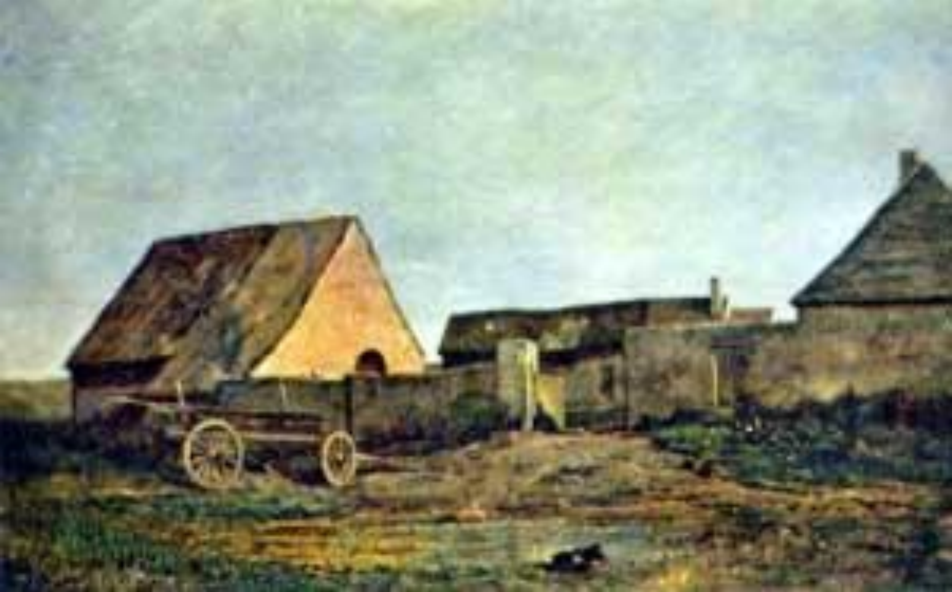
Шарль Добиньи (1817-1878). "Крестьянский двор"