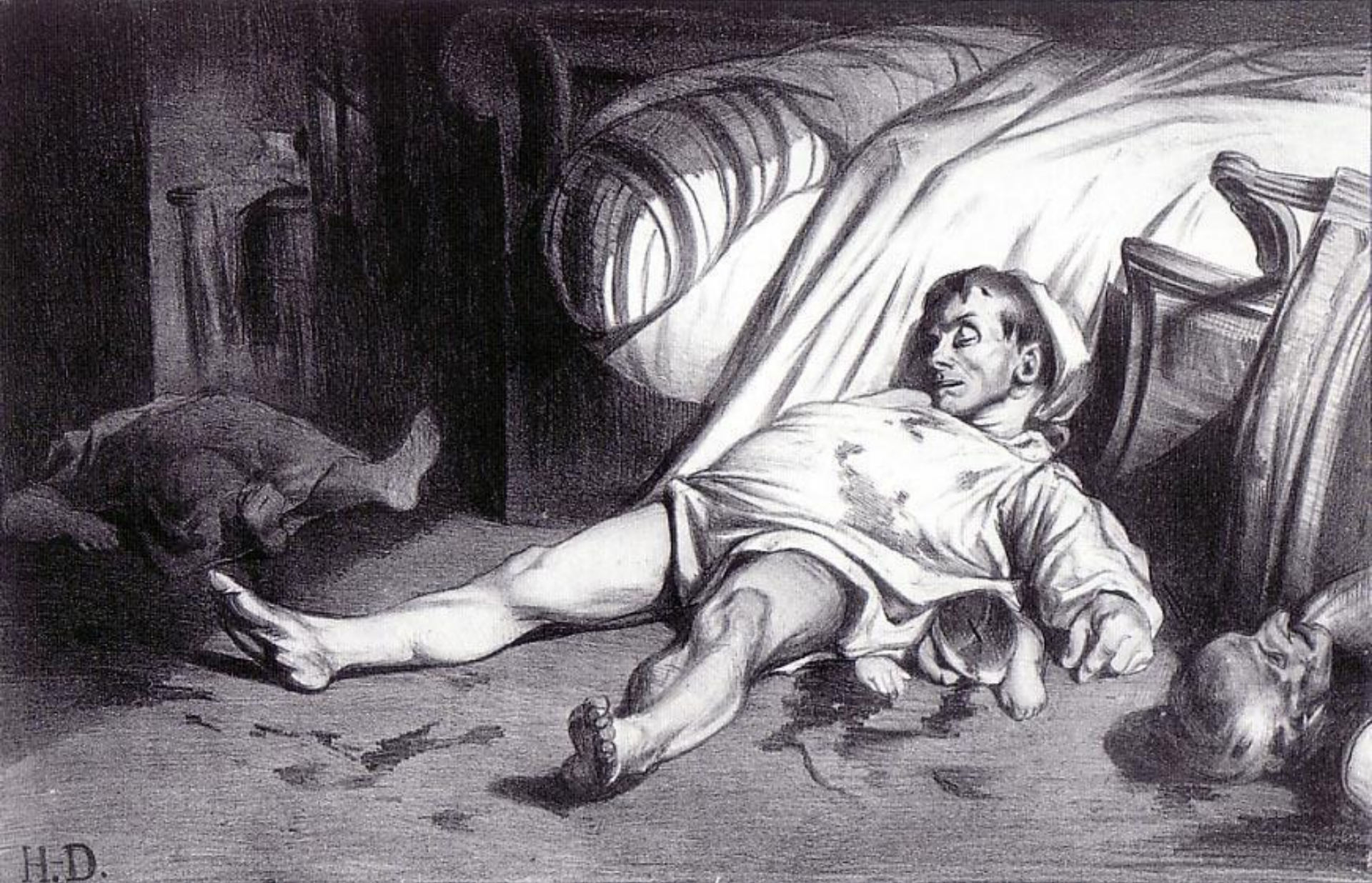
"Улица Транснонен" (1834)