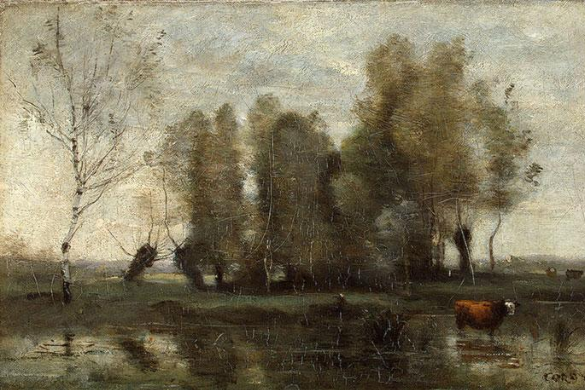
"Деревья среди болота"