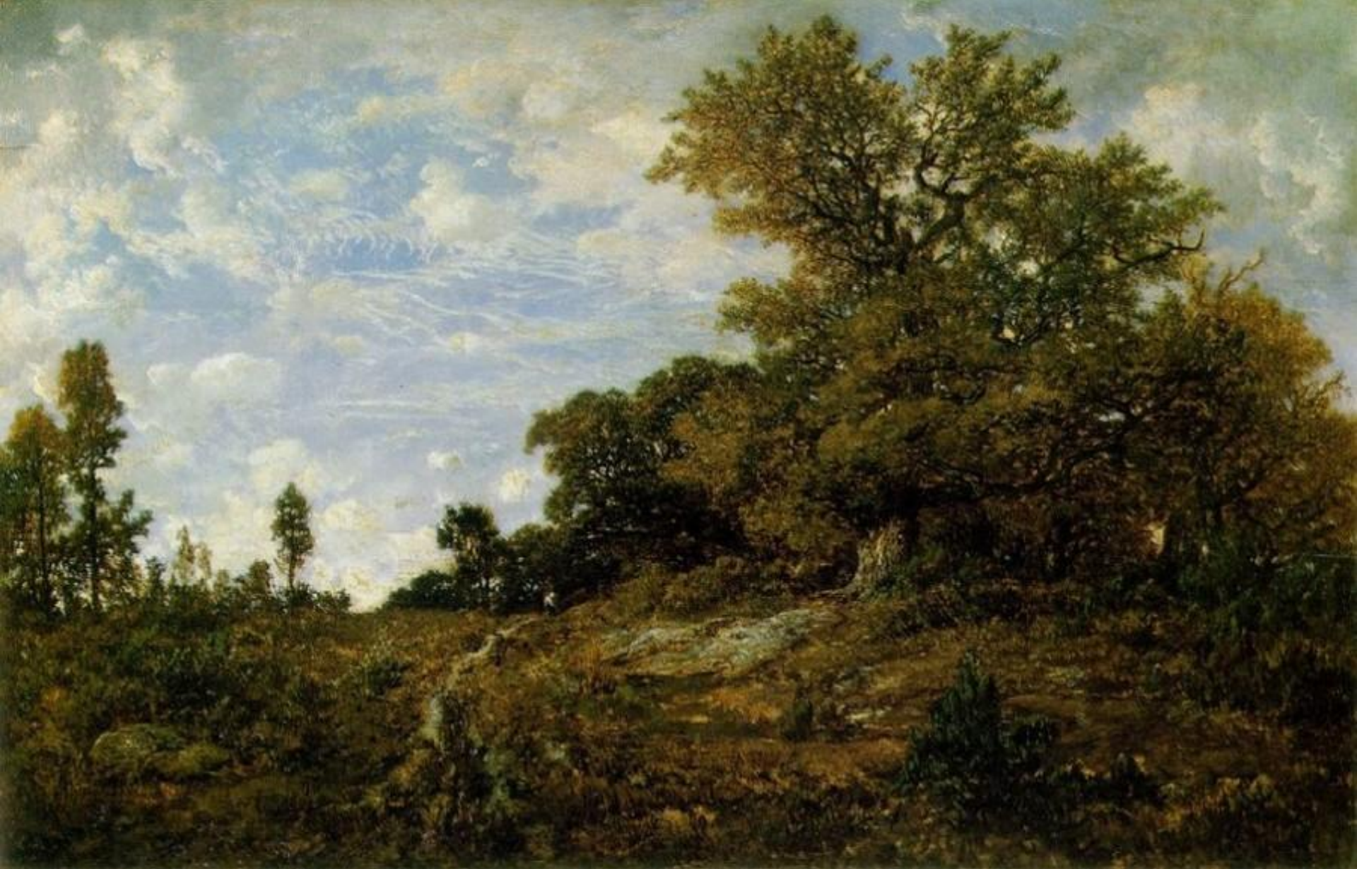
"Опушка леса в Фонтенбло" (1854)