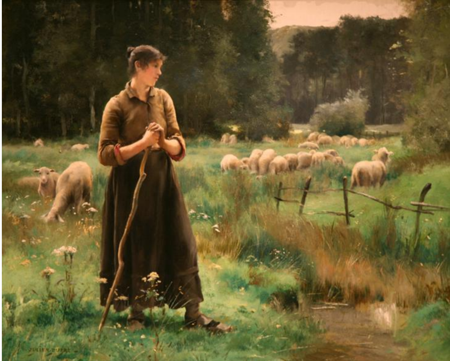
Жюль Дюпре "Крестьянка с овцами"