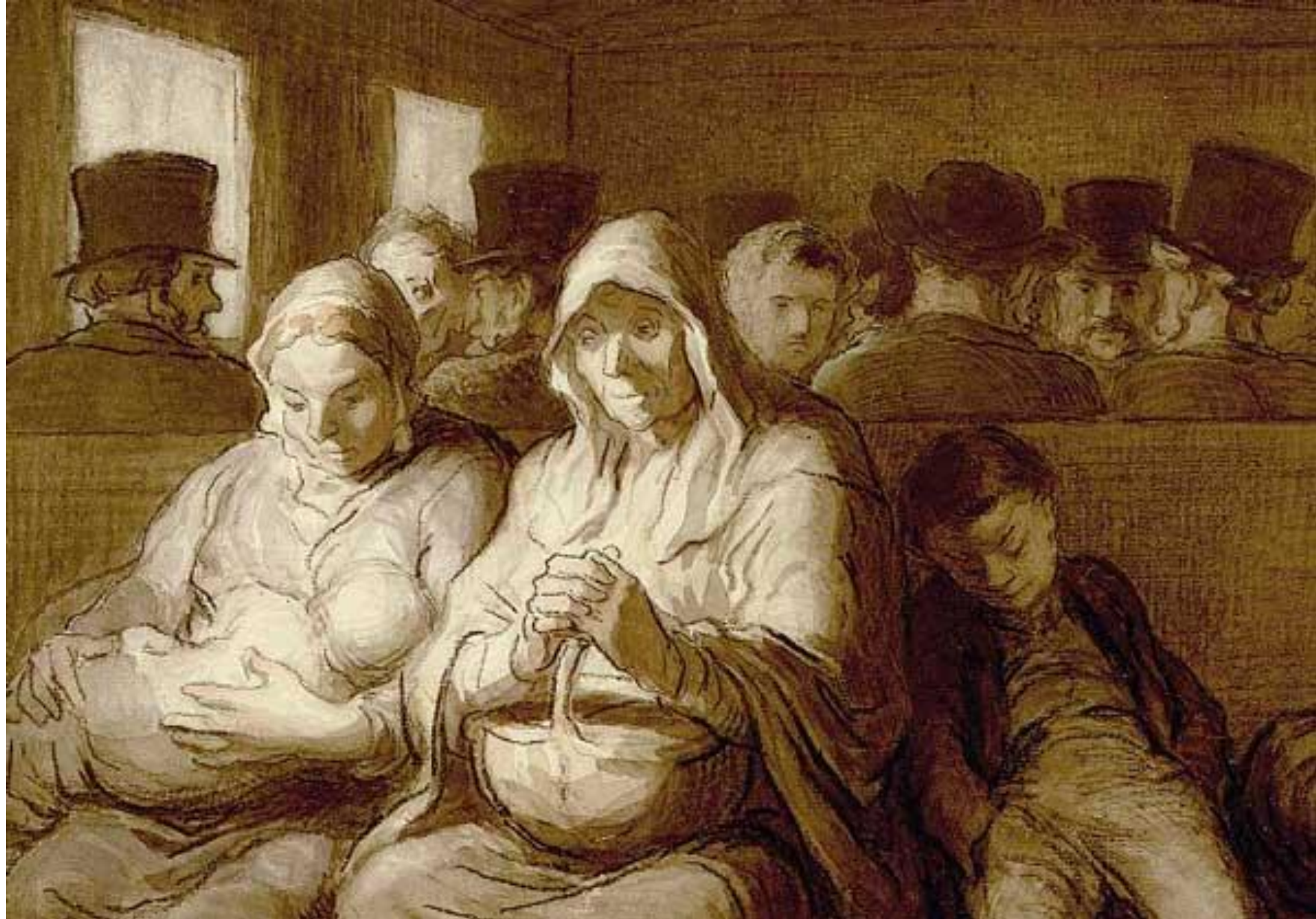
"Вагон третьего класса"