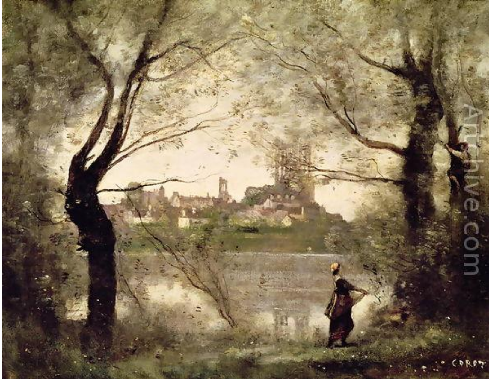
"Собор в Нанте"