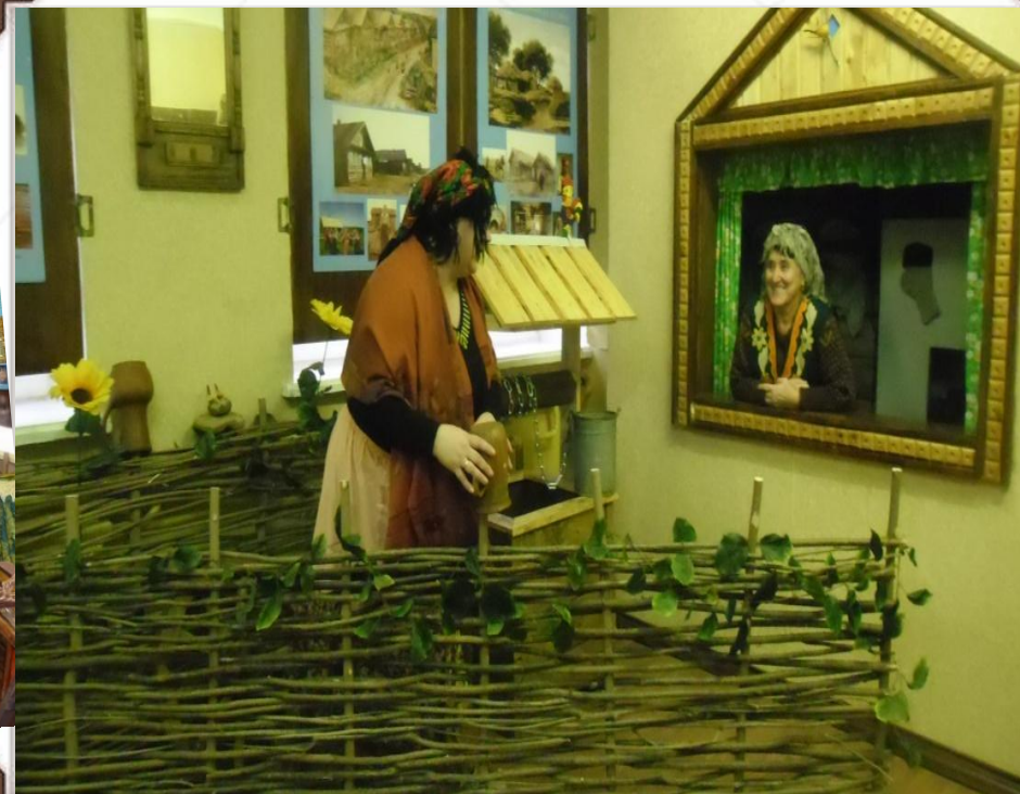
Зал № 1. Фрагмент экспозиции «Крестьянский быт и труд Припьянья», «Детство и отрочество Никиты».