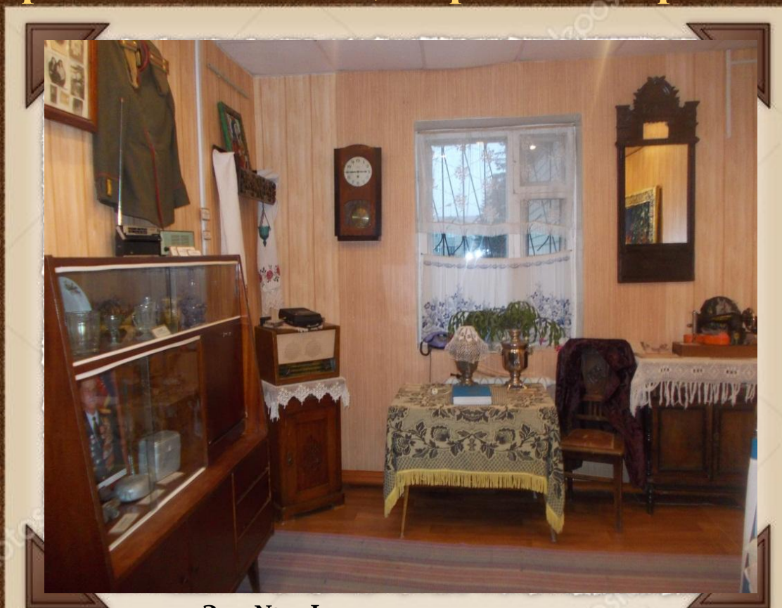
Зал № 3 Фрагмент экспозиции "События и интерьеры второй половины 20 века" "Отчий дом - мой дом в Припьянье"