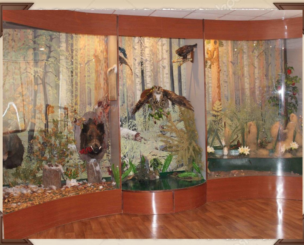
Зал № 5 Фрагмент экспозиции "Природа Припьяня"

(Экспозиция посвящена уникальной природе Перевозского Припьяня)