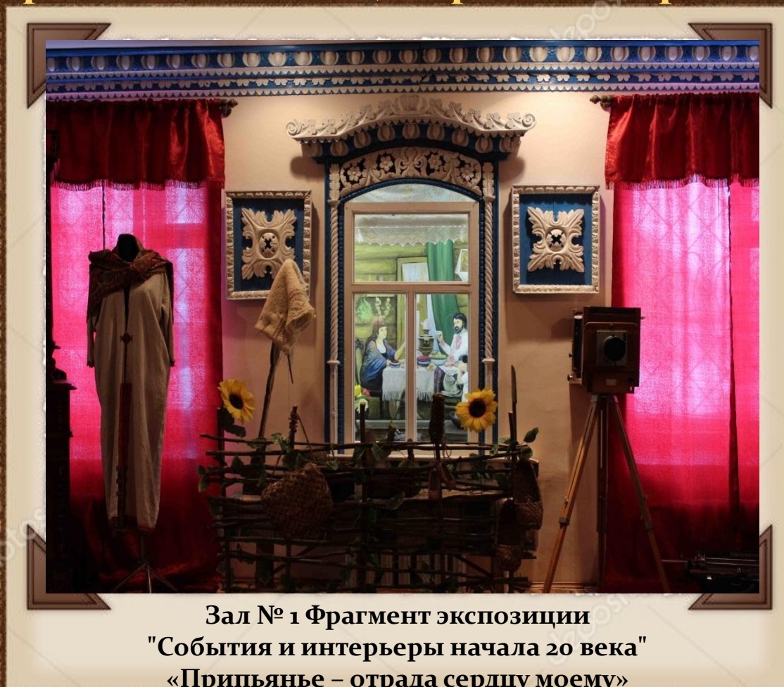
Зал № 1 Фрагмент экспозиции "События и интерьеры начала 20 века" «Припьянье – отрада сердцу моему» (История Перевоза уездного и заштатного на р. Пиане)