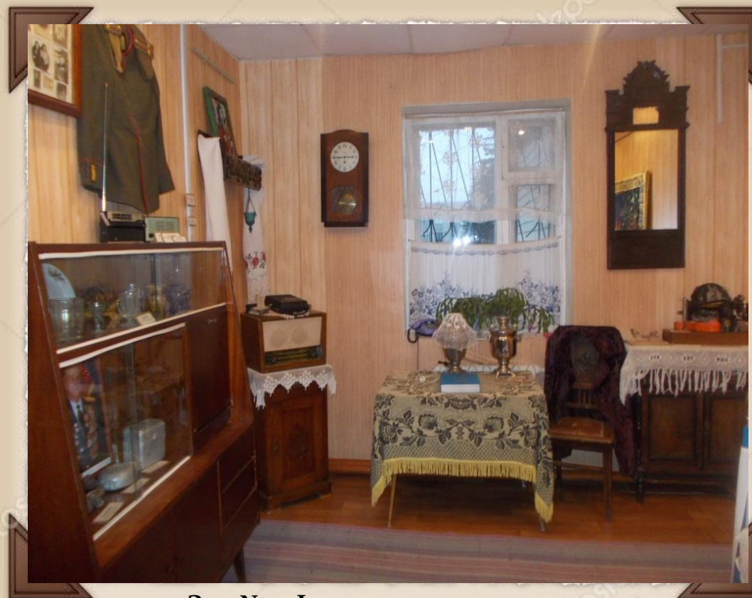
Зал № 3 Фрагмент экспозиции "События и интерьеры второй половины 20 века" "Отчий дом - мой дом в Прип'янье"