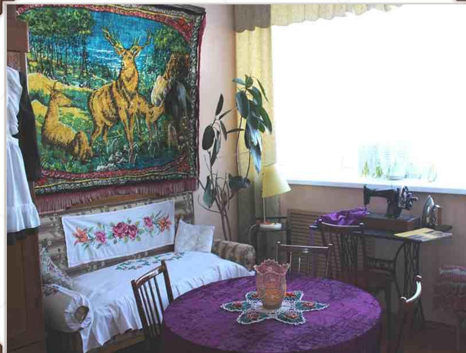
Фрагмент экспозиции «Домик у дороги»