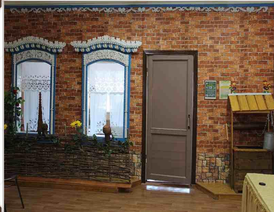
Фасад экспозиции «Домик у дороги»