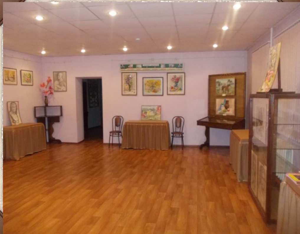
Зал № 4 Зал сменных выставок