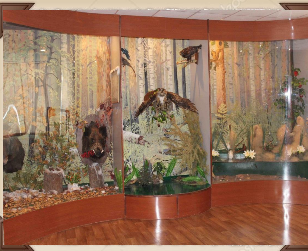
Зал № 5 Фрагмент экспозиции "Природа Припьянья"

(Экспозиция посвящена уникальной природе Перевозского Припьянья)