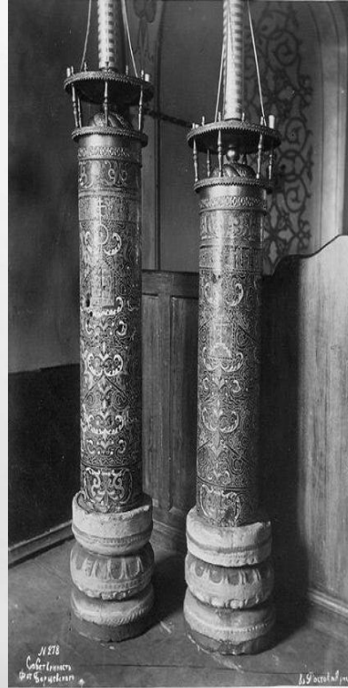
Восковые подсвечники и тощая свеча из Богородицкой церкви, XVII в.