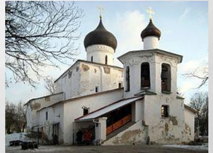
Церковь Василия Великого, задействованная староверами в годы немецкой оккупации