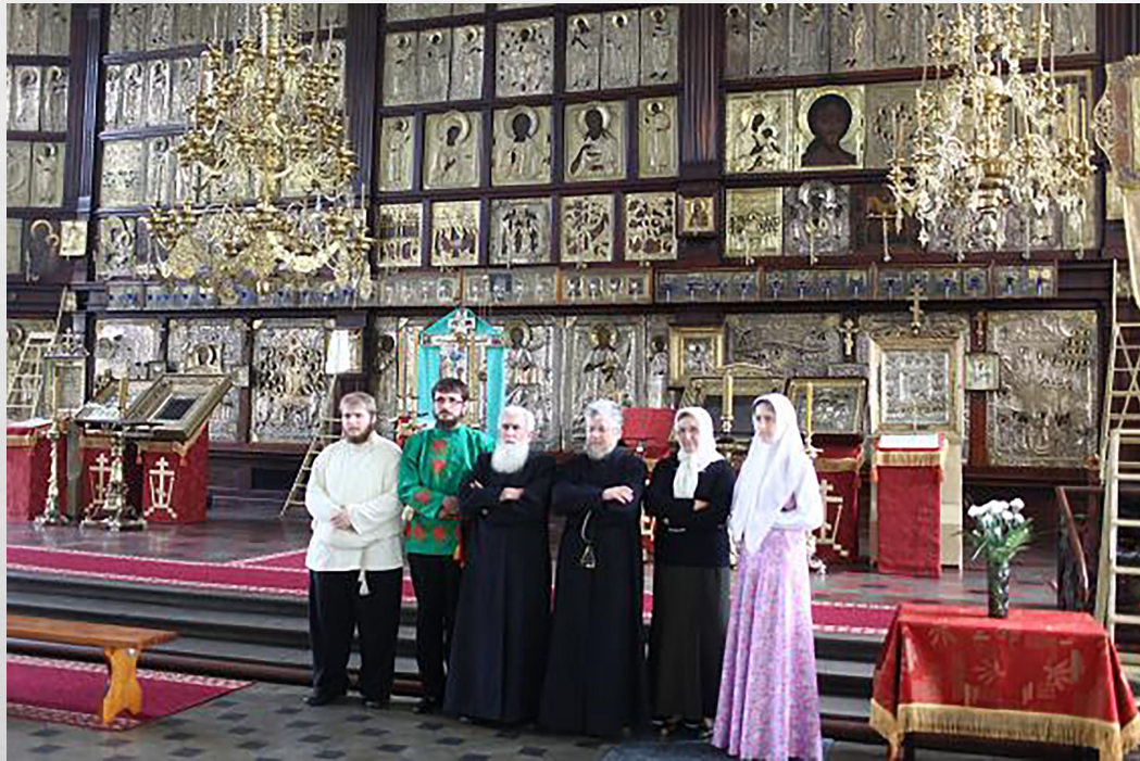
Хор старообрядцев- беспоповцев