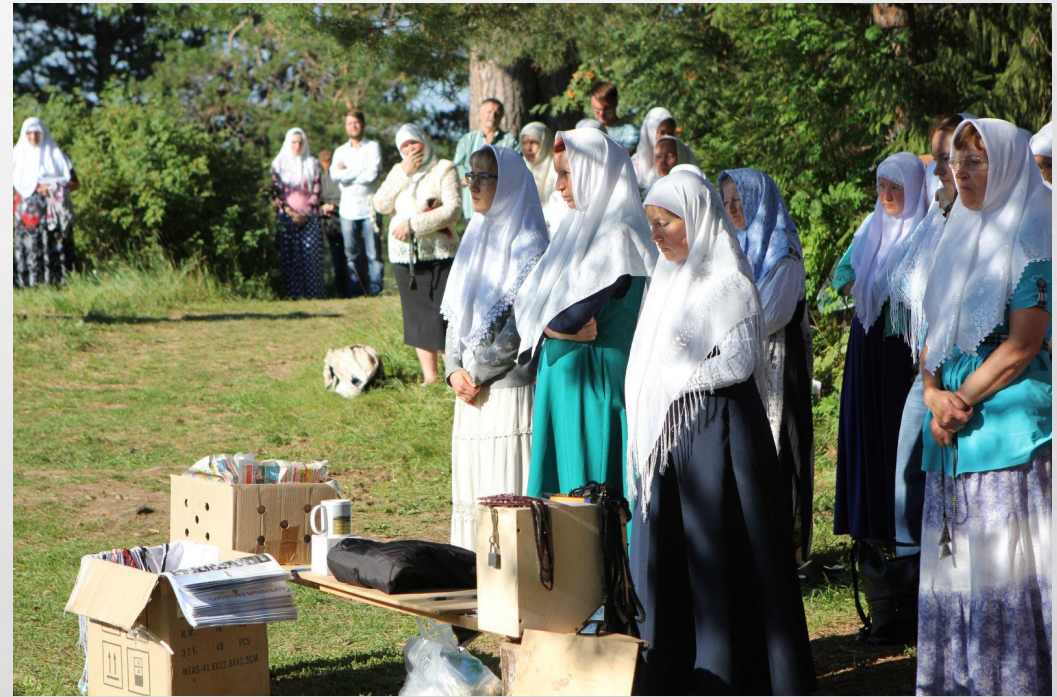
Вятские старообрядцы, Кировская область