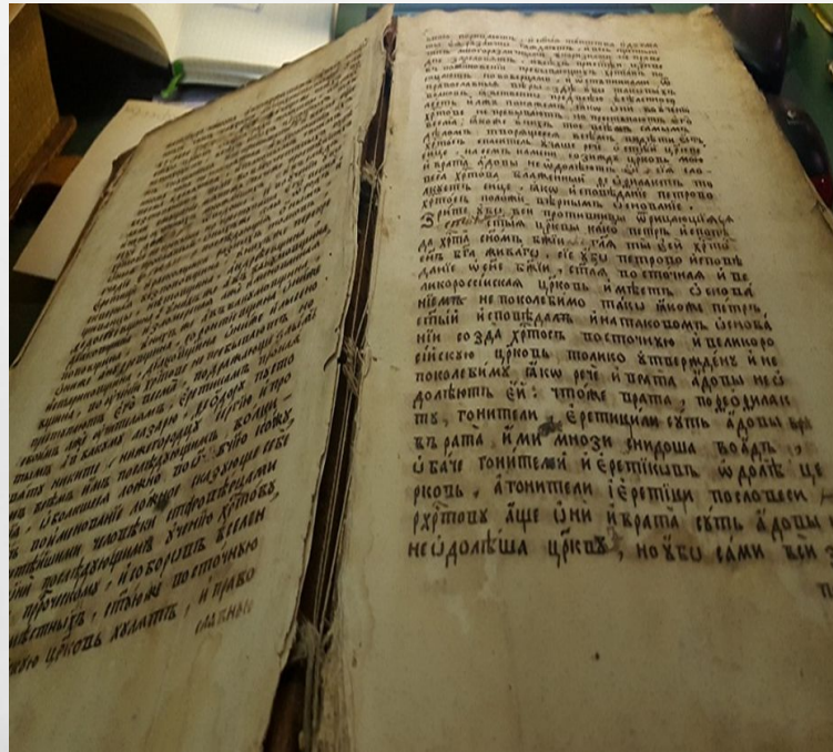
Сочинение протопопа Аввакума (рукопись)