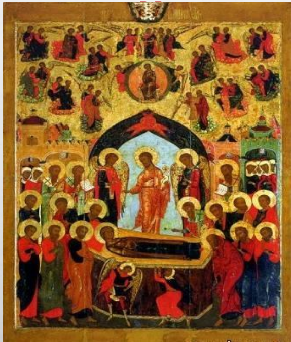
Успение Богородицы из Богородицкой церкви