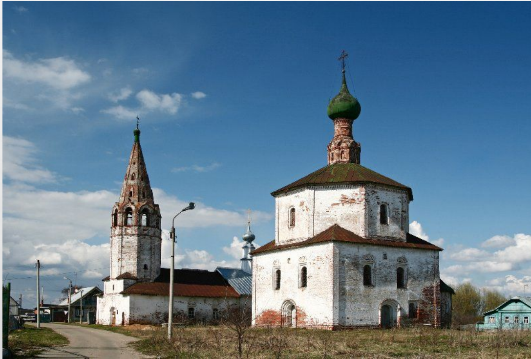
Старообрядческий церковный комплекс (церкви свв. Козьмы и Дамиана и Крестовоздвиженская), г. Суздаль