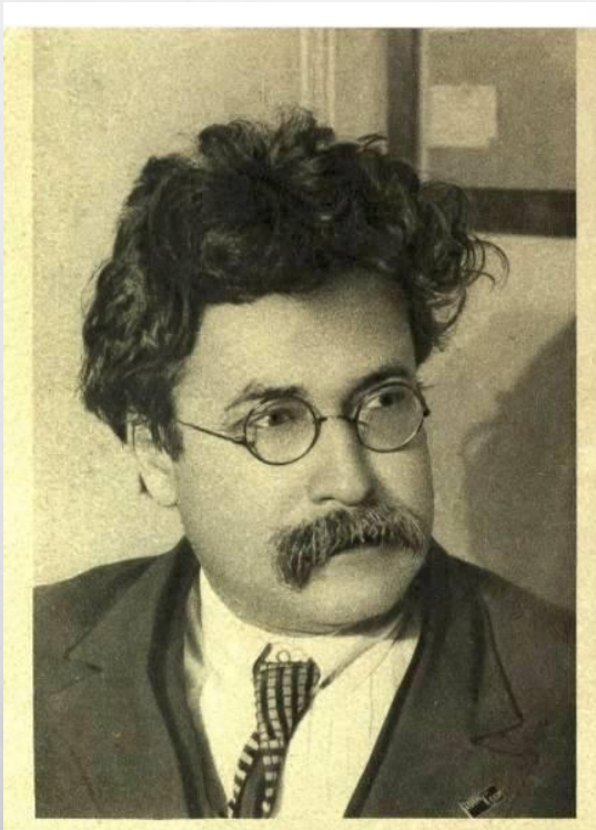
Е. М. Ярославский (1878-1943), возглавлявший Антирелигиозную комиссию при ЦК ВКП(б)