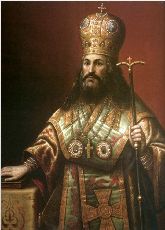
Патриарх Московский Никон (1605-1681), основатель никонианства