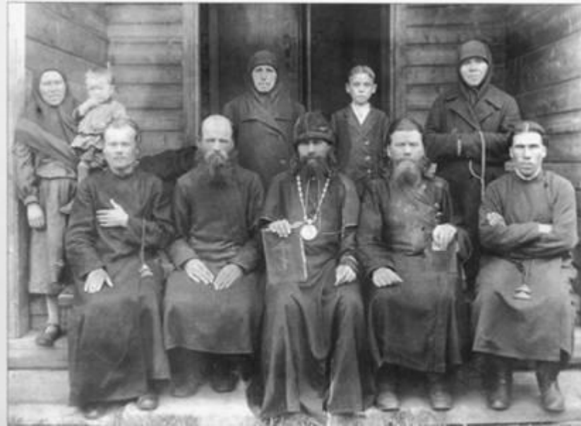
Староверы Ново-Архангельского скита, образованного в тайге до революции 1917 г.