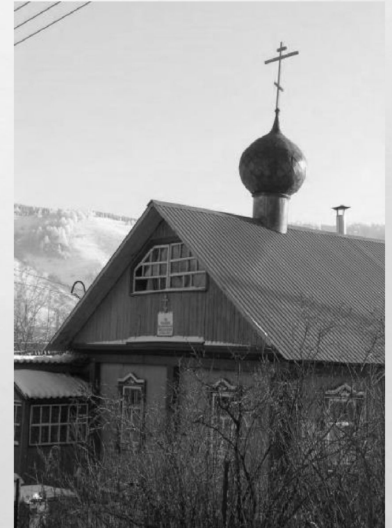
Церковь во имя Пресвятой Богородицы Одигитрии, г. Горно-Алтайск