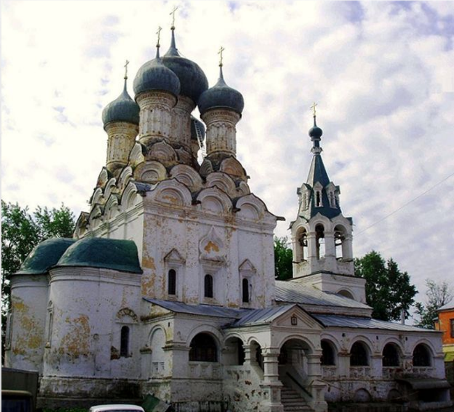
Старообрядческая церковь Успения Богородицы, г. Владимир (современно состояние)