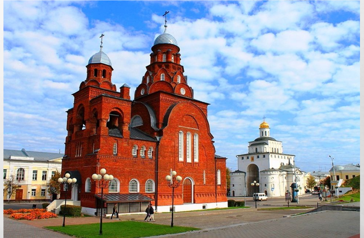
Бывшая старообрядческая церковь Св. Троицы, г. Владимир (современно состояние)