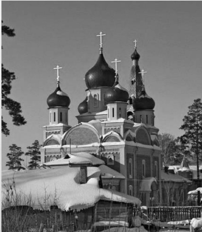
Кафедральный собор во имя Рождества Пресвятой Богородицы, г. Новосибирск