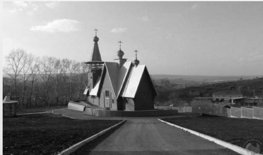
Церковь во имя Пресвятой Богородицы «Всем скорбящим радость», г. Кемерово