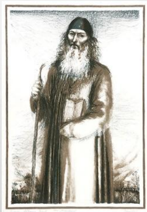
Аввакум Петров (1620-1682), идеолог старообрядчества