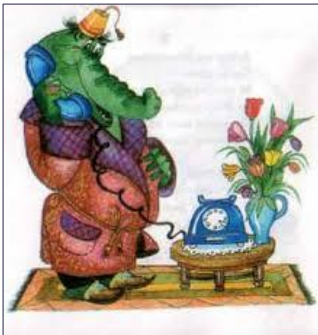
К.И. Чуковский «Телефон»

- Посто́й, не тебе ли на прошлой неделе Я выслал три пары отличных калош? - Ах, те, что ты выслал на прошлой неделе, Мы давно уже съели. И ждём не дождёмся, когда ты Пришлёшь К нашему ужину дюжину Новых отличных и сладких калош!