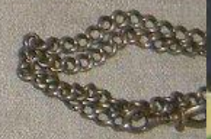
ЧАСЫ КАРМАННЫЕ участника воздушного десанта на Днепре Ю.М. УХАБИН.