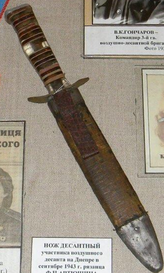
НОЖ ДЕСАНТНЫЙ участника воздушного десанта на Днепре в сентябре 1943 г. рязанца Ф.Н. АРТИУШИНА