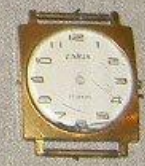
ЧАСЫ УЧАСТНИКА воздушного десанта на Днепре ШЕВЧУКА В.Г.