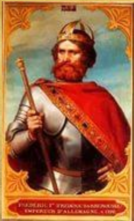
Фридрих I Барбароса