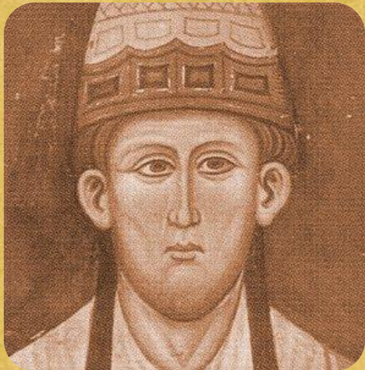
Организатор : папа Иннокентий III