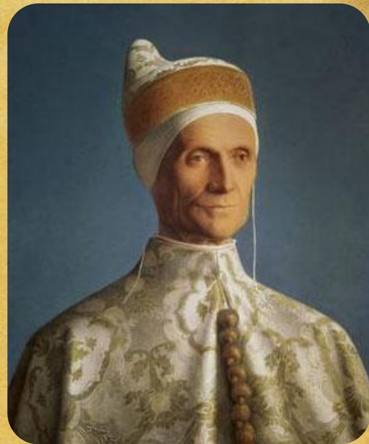
Энрике Дандоло- венецианский дож