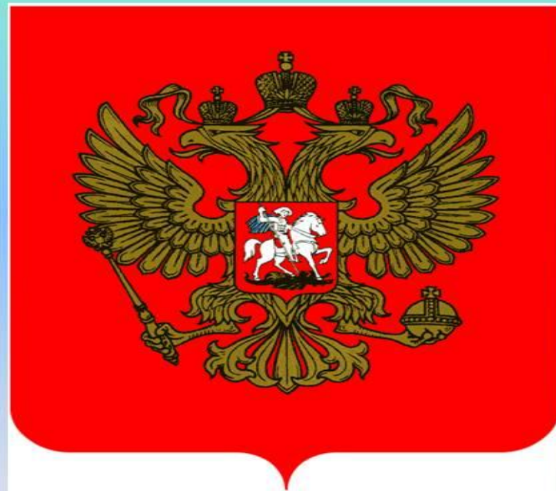
Флаг и герб России