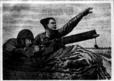
Бьется ны здорово, Рубик оглашено, Вуки Суворова, Дети Чапая.

В этот день в 1917 году в Москве состоялся съезд ЦК ВКП(б) и XXIV годовщины Великой Октябрьской Социалистической Революции. В этот день в 1917 году в Москве состоялся съезд ЦК ВКП(б) и XXIV годовщины Великой Октябрьской Социалистической Революции.