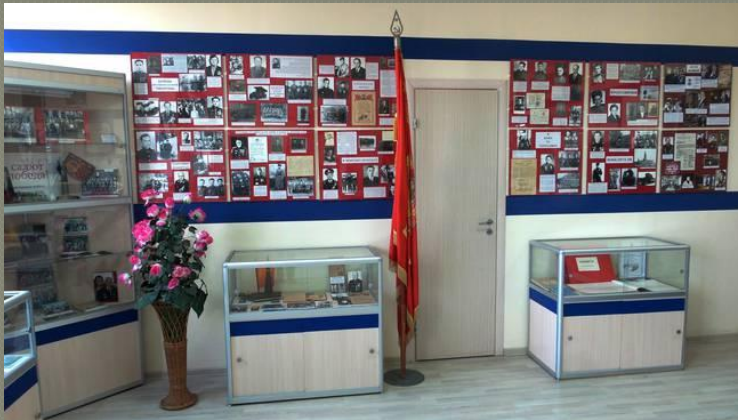
«Патриотическое воспитание ВПИ-ВлГУ»