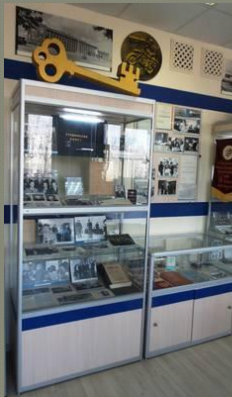
«Владимирский филиал Московского вечернего машиностроительного института (1958-1964)»