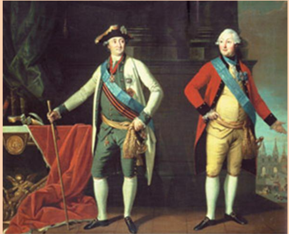
Ж.Л. де Велли. Граф А.Г. Орлов-Чесменский и его брат князь Г.Г. Орлов, удостоенный золотой медали за избавление Москвы от моровой язвы в 1771 г.

Ранним утром 28 июня 1762 г., пока Пётр III находился в Ораниенбауме, Екатерина в сопровождении Алексея и Григория Орловых приехала из Петергофа в Санкт-Петербург, где ей присягнули на верность гвардейские части