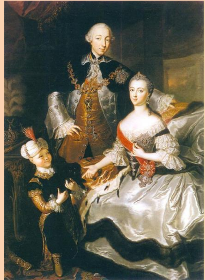
Великая княгиня Екатерина Алексеевна с супругом Петром III Фёдоровичем