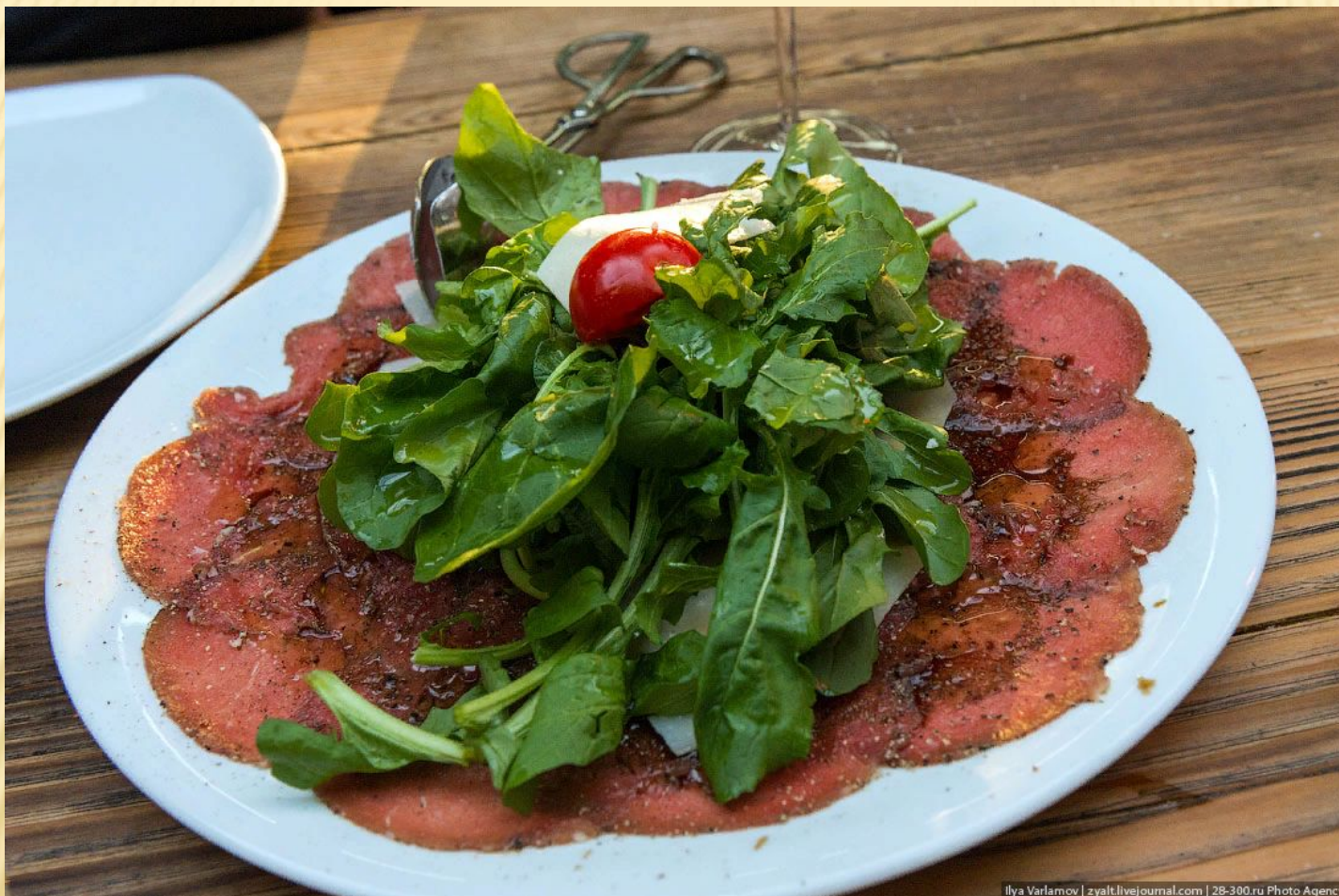
Карпаччо(Блюдо из тонко нарезанных кусочков сырой говяжьей вырезки, приправленной соусом на основе майонеза)- 15$