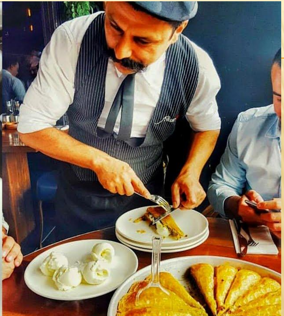
Традиционный турецкий десерт- пахлава; подается в ресторане Nusret с мороженым.