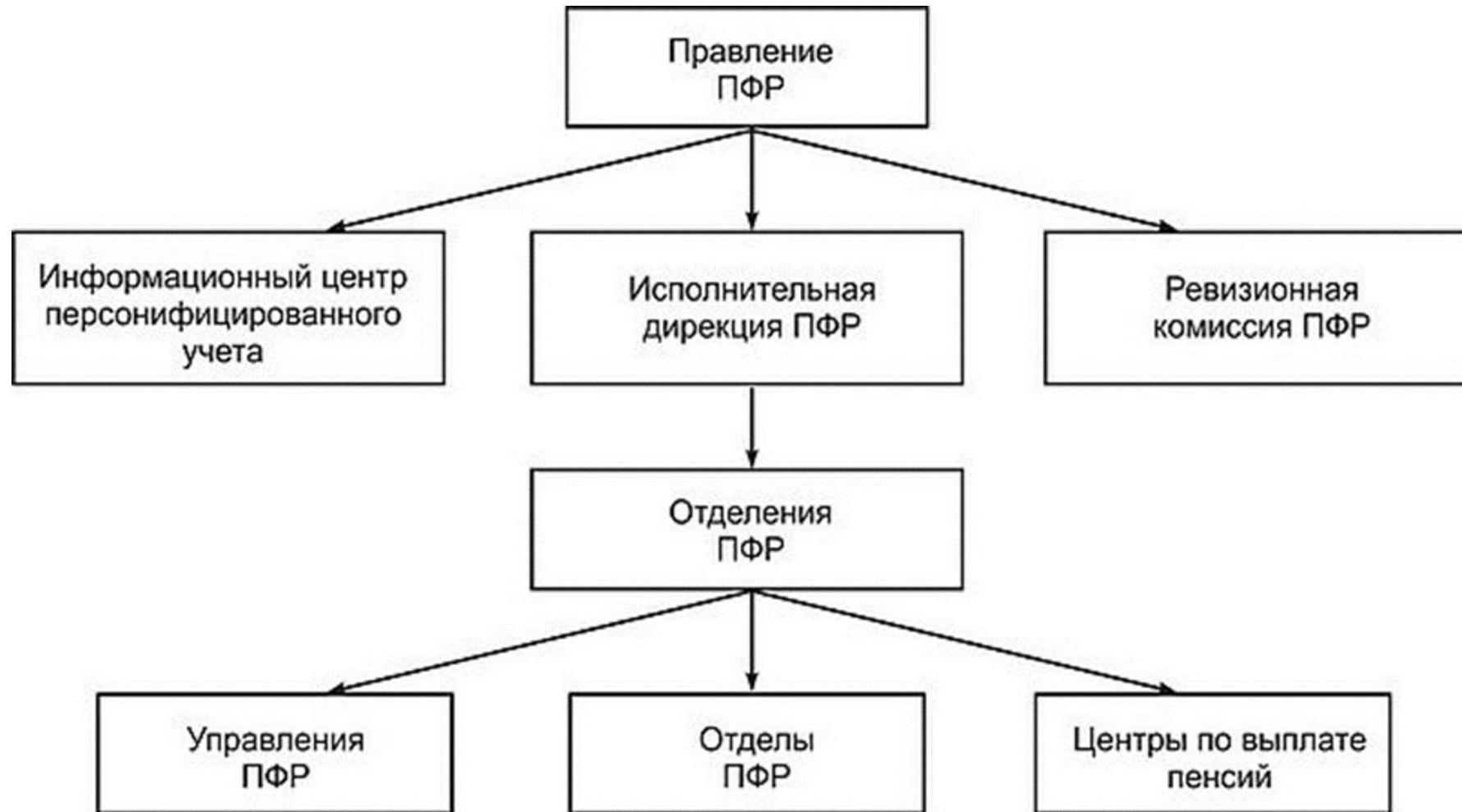
Схема пенсионного фонда в СССР