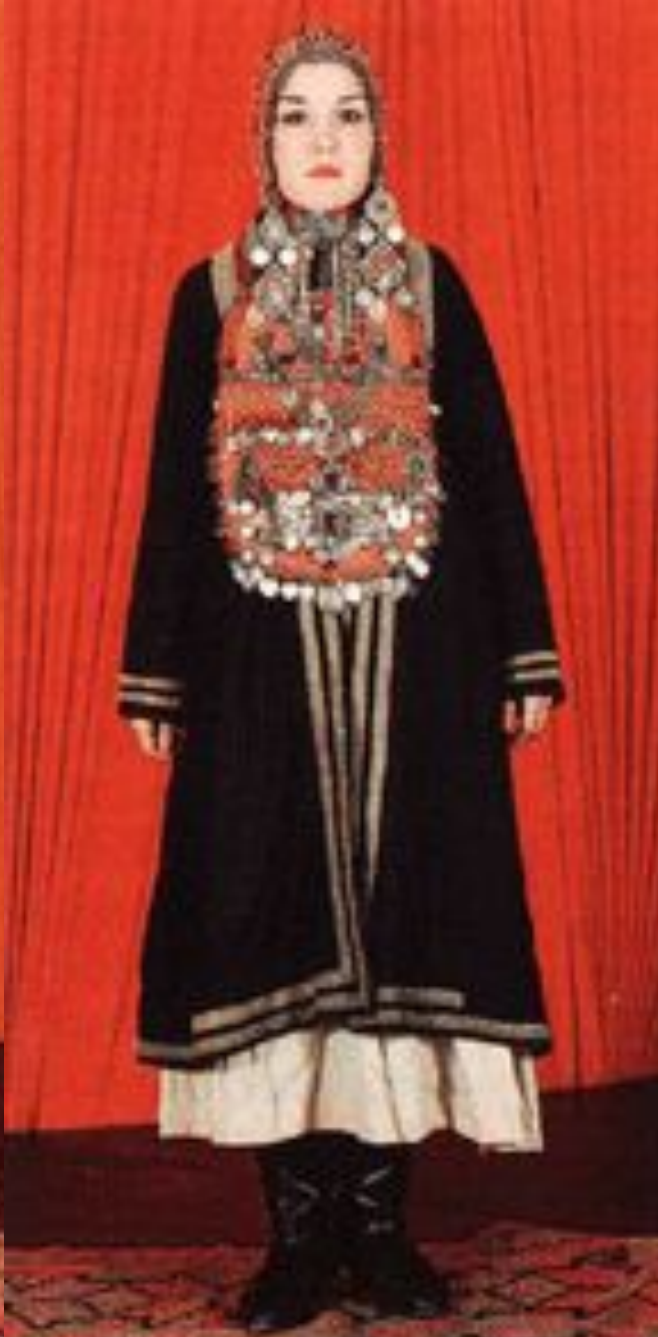
Башкирский женский костюм