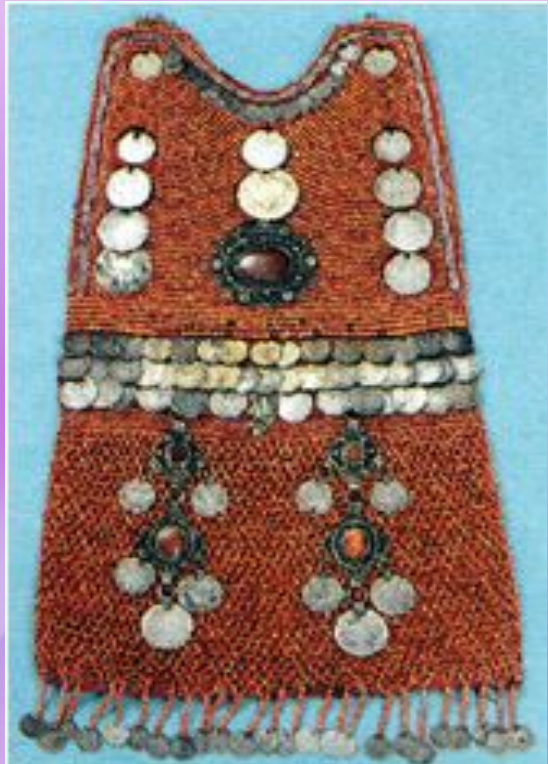
нагрудное украшение (селгэр)