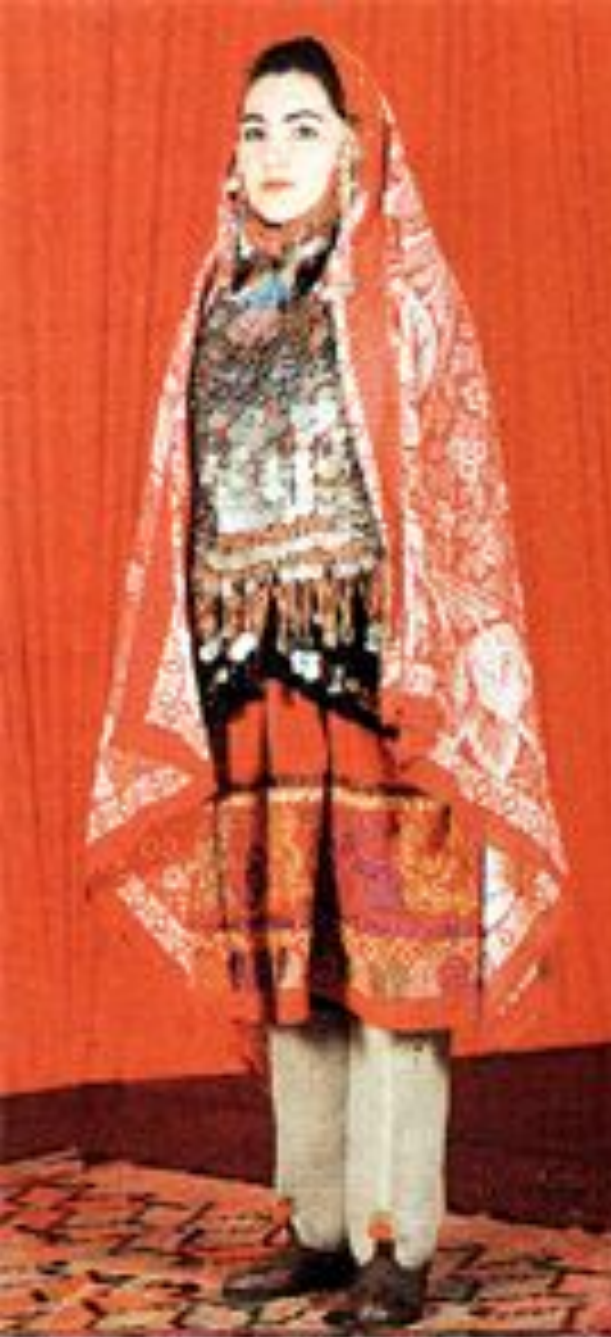
Башкирский женский костюм