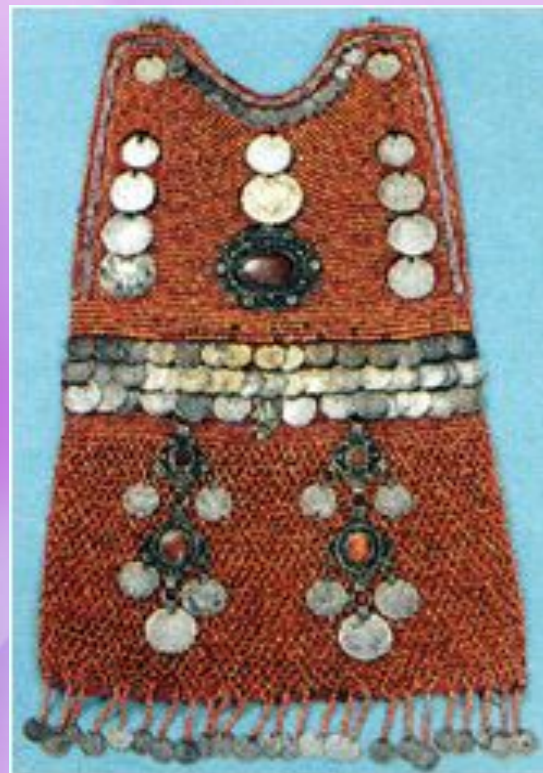
нагрудное украшение (селгэр)