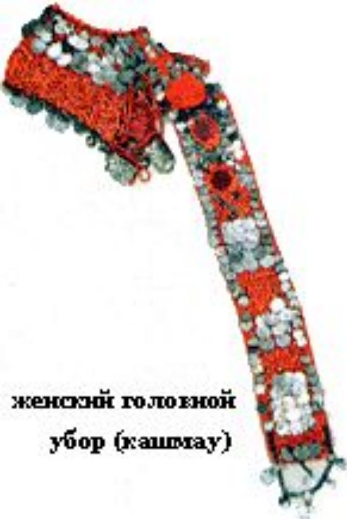
женский головной убор (кашгату)