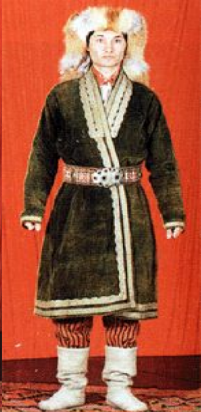
Башкирский мужской костюм