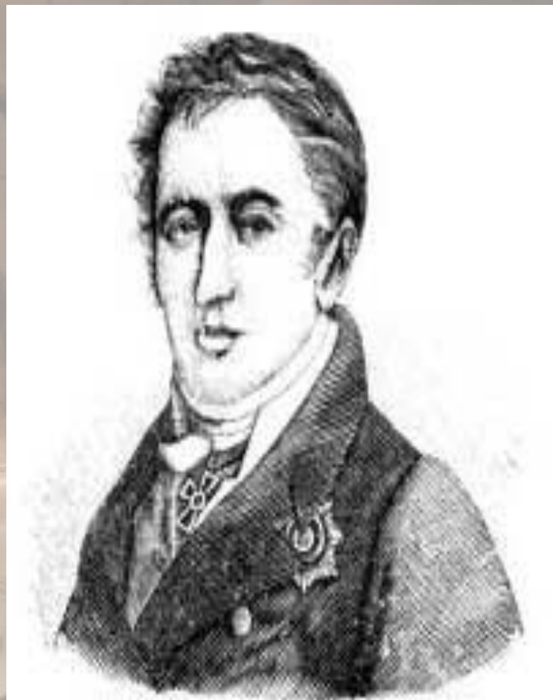
Карамзинъ, Н. М.

Одновременно посещал в 1781—1782 годах лекции И. Г. Шварца в Университете.