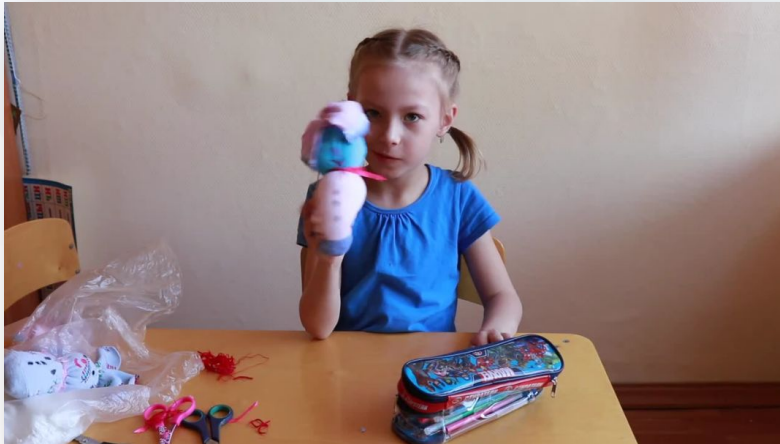
Зайчик из носки