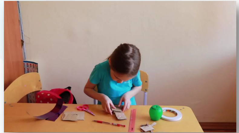
Тумбочка для кукольного домика