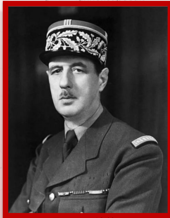
Лондон. 1940 г.

Его речь, транслировавшаяся из Лондона и ставшая важной вехой в истории Второй мировой войны, включена ЮНЕСКО в реестр «Память мира».