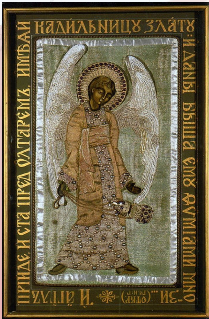
«Ангел с кадилом». Вышивка матери Марии.

Она открыла в Париже на улице Лурмель женское общежитие со столовой, где давала приют для бездомных, обиженных или нуждавшихся в помощи, а при общежитии – домовую церковь.