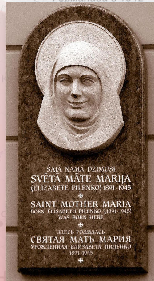
Мемориальная доска в Риге на доме, где родилась мать Мария (урожденная Елизавета Пиленко)

По другой версии, она поменялась с женщиной местами. Истину установить сегодня уже невозможно.