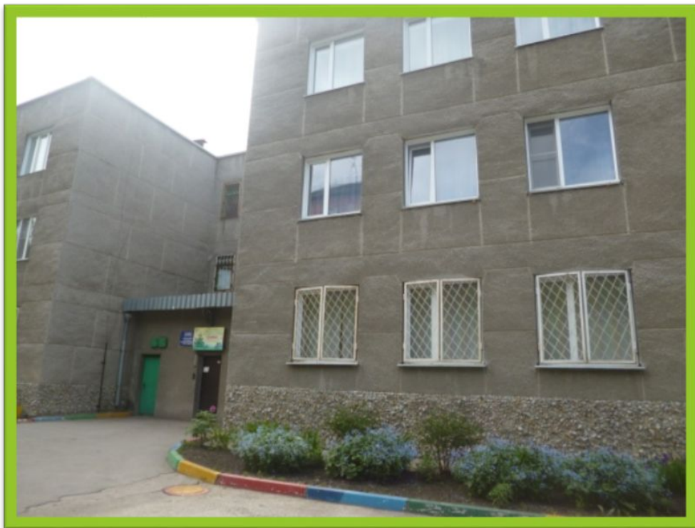
1 корпус (Плахотного 15а)