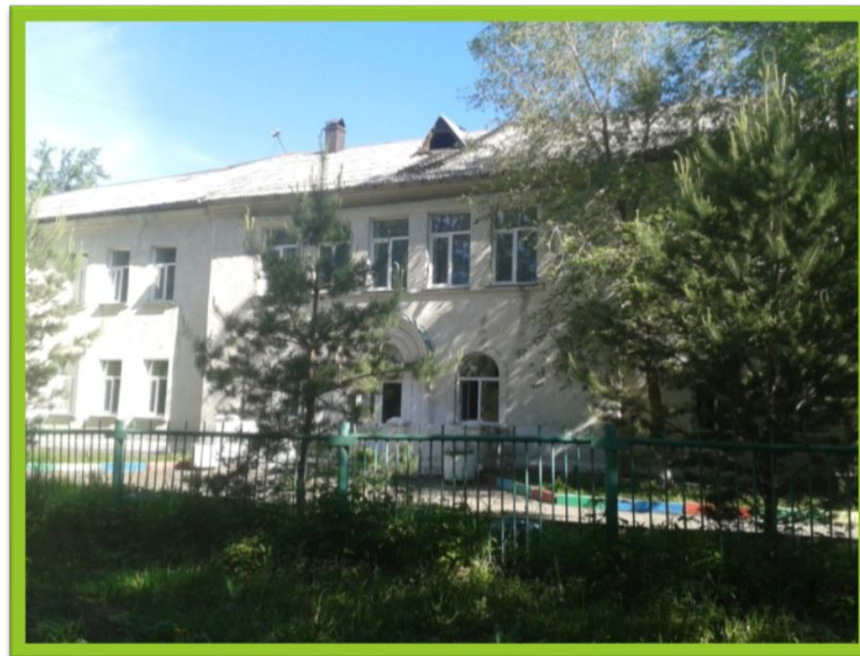
2 корпус (Титова 24)