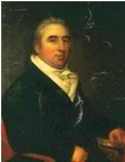
Уильяма Мэрбэри. Назначен президентом Джоном Адамсом на должность мирового судьи округа Колумбия

«Закон о судоустройстве 1789 года» (Judiciary Act of 1789)