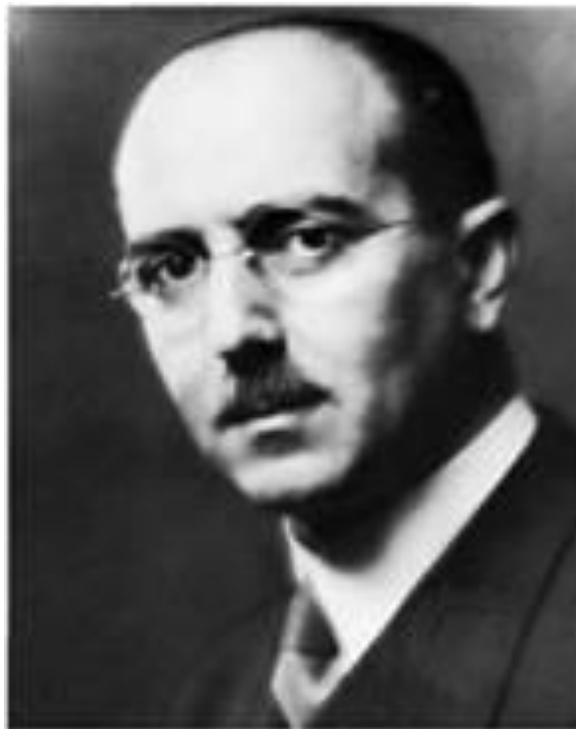
ГАНС КЕЛЬЗЕН (1881 – 1973)