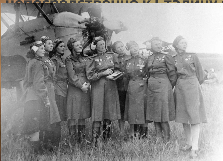
Летчицы 46-го гвардейского авиационного полка

Что касается летчиц, то у нас было три женских авиационных полка: 586-, 587- и 588-й. 588-й впоследствии (в феврале 1943 года) был переименован в 46-й Гвардейский Таманский полк. Летчиц именно этого полка немцы прозвали «Ночными ведьмами». Указ об их создании вышел 8 октября 1941 года. Это произошло благодаря известной летчице Марине Михайловне Расковой, которая уже на тот момент была Героем Советского Союза и обратилась непосредственно к Сталину с таким пред