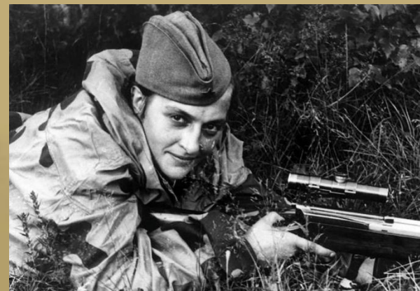
Павличенко Людмила Михайловна