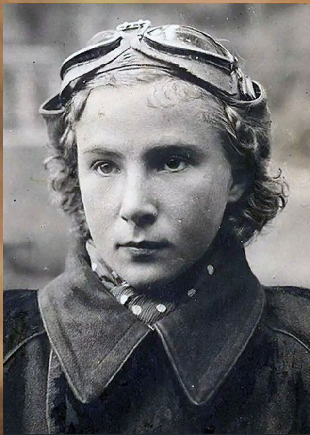
Лидия Владимировна Литвяк

Среди женщин, пилотировавших истребители, одна из самых известных – это Лидия Литвяк, которую называли «Белая лилия Сталинграда». Она вошла в историю как самая результативная женщина-истребитель: на ее счету было 16 побед – 12 личных и 4 групповых.