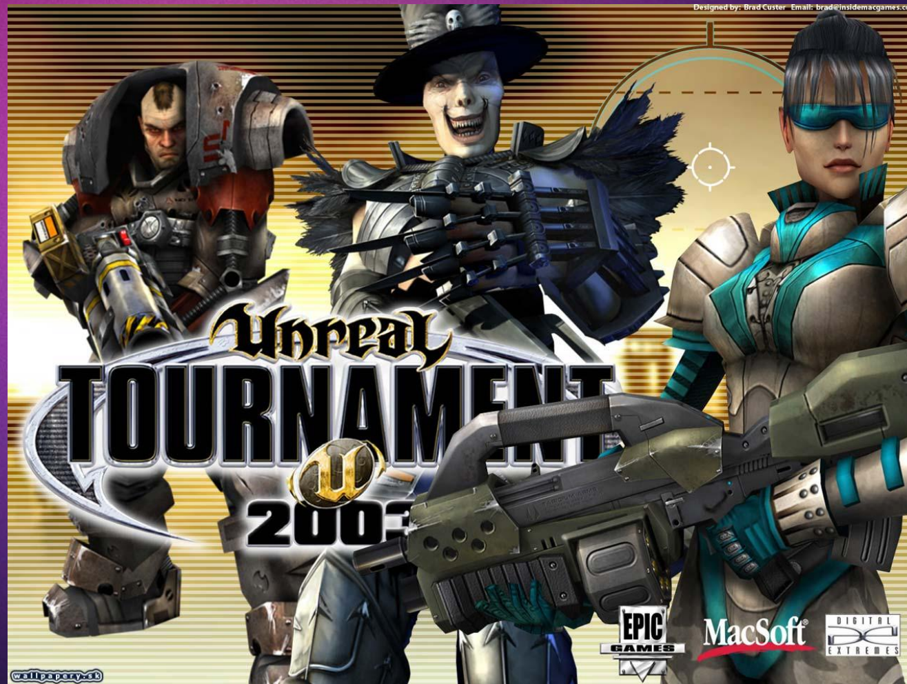
Unreal Tournament 2003