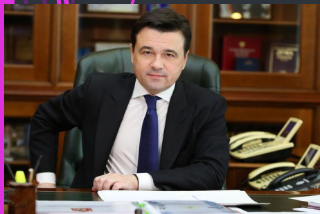
Губернатор МО Воробьев А.Ю

Герб Московской области представляет собой тёмно-красный геральдический щит с изображением Георгия Победоносца на коне, поражающего змея. Флаг области - Ширина основного элемента изображения герба (фигуры Георгия Победоносца), размещаемого в левом верхнем углу полотнища, составляет \frac{1}{5} длины флага. Герб Утверждён 15 июля 2005, Флаг Утверждён 3 декабря 1997