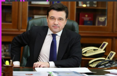
Губернатор МО Воробьев А.Ю