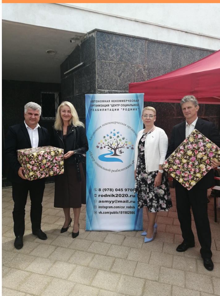
Районная Гагаринская администрация