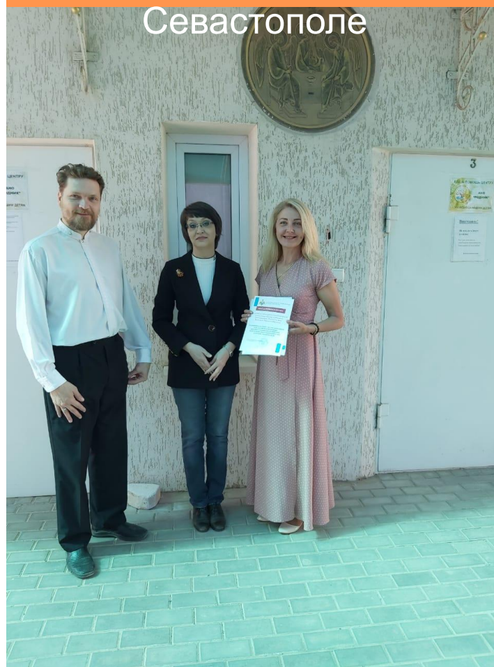
Уполномоченный по правам ребенка в Севастополе