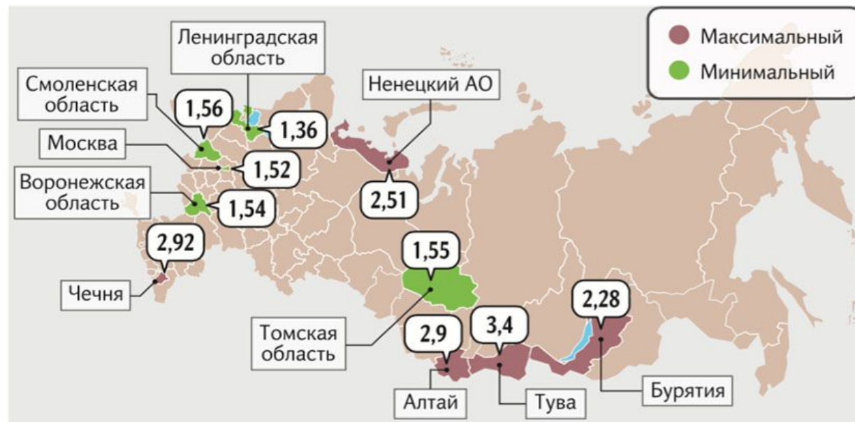
Ожидаемый коэффициент рождаемости к 2020 году