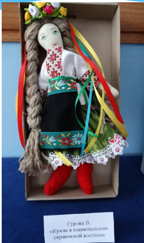
Гурова В. «Кукла в национальном украинский костюм»