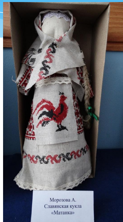
Морозова А. Славянская кукла «Матанка»