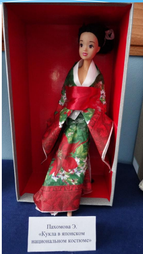
Пахомова Э. «Кукла в японском национальном костюме»