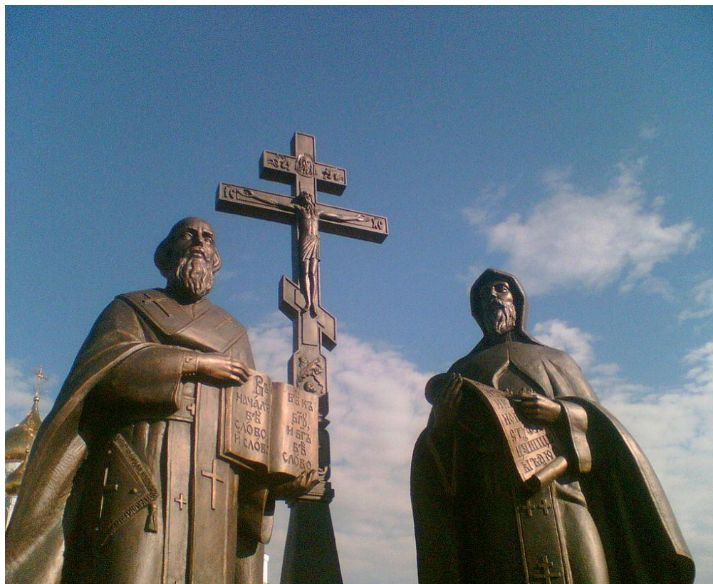
Святые Кирилл и Мефодий памятник в Ханты-Мансийске.