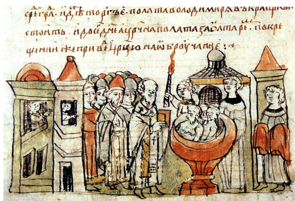
Крещение великого князя Владимира. Радзивилловская летопись. Кон. XV в.