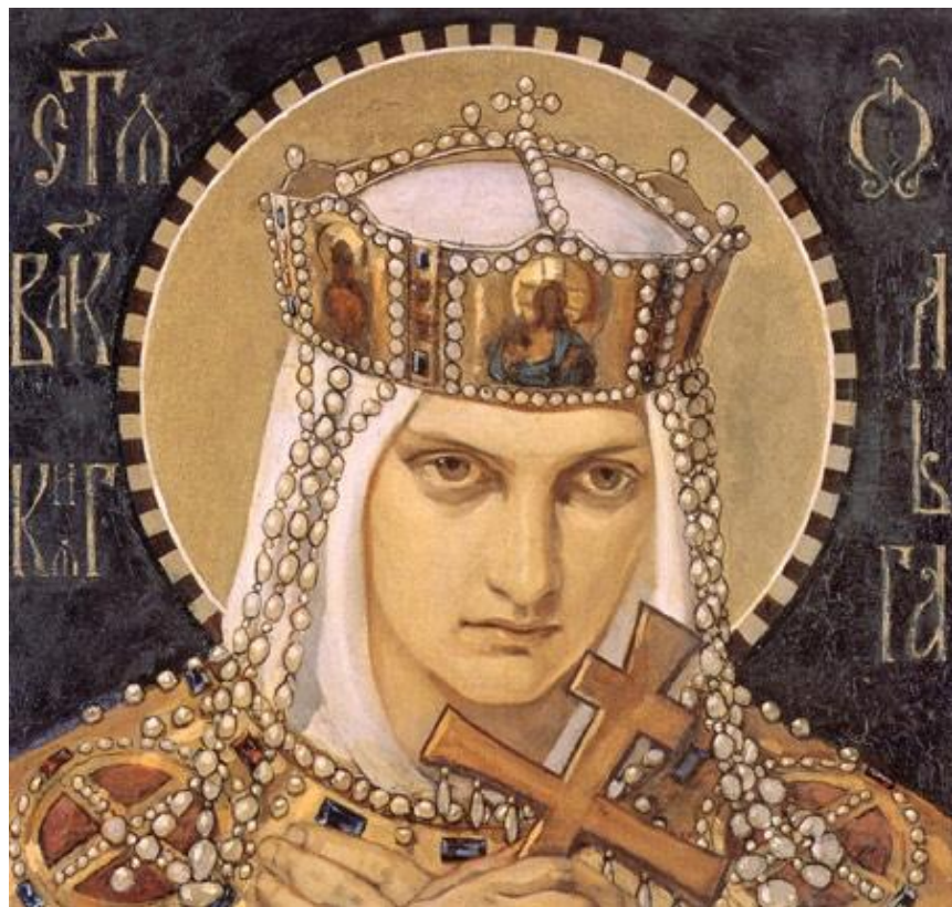
Н. А. Бруни «Святая великая княгиня Ольга 1901» г.

Христианство в Древней Руси существовало еще задолго до придания ему статуса официальной религии. Византийские источники сообщали о крещении «Руси» после ее похода на Константинополь в 860 г. Во главе этого похода на столицу Византийской империи стояли киевские князья Аскольд и Дир, которые, по преданию, крестились первыми. Можно с уверенностью говорить не только о наличии среди руссов отдельных христиан, но и о существовании среди них христианской общины, помимо Киева, и в других центрах Руси.