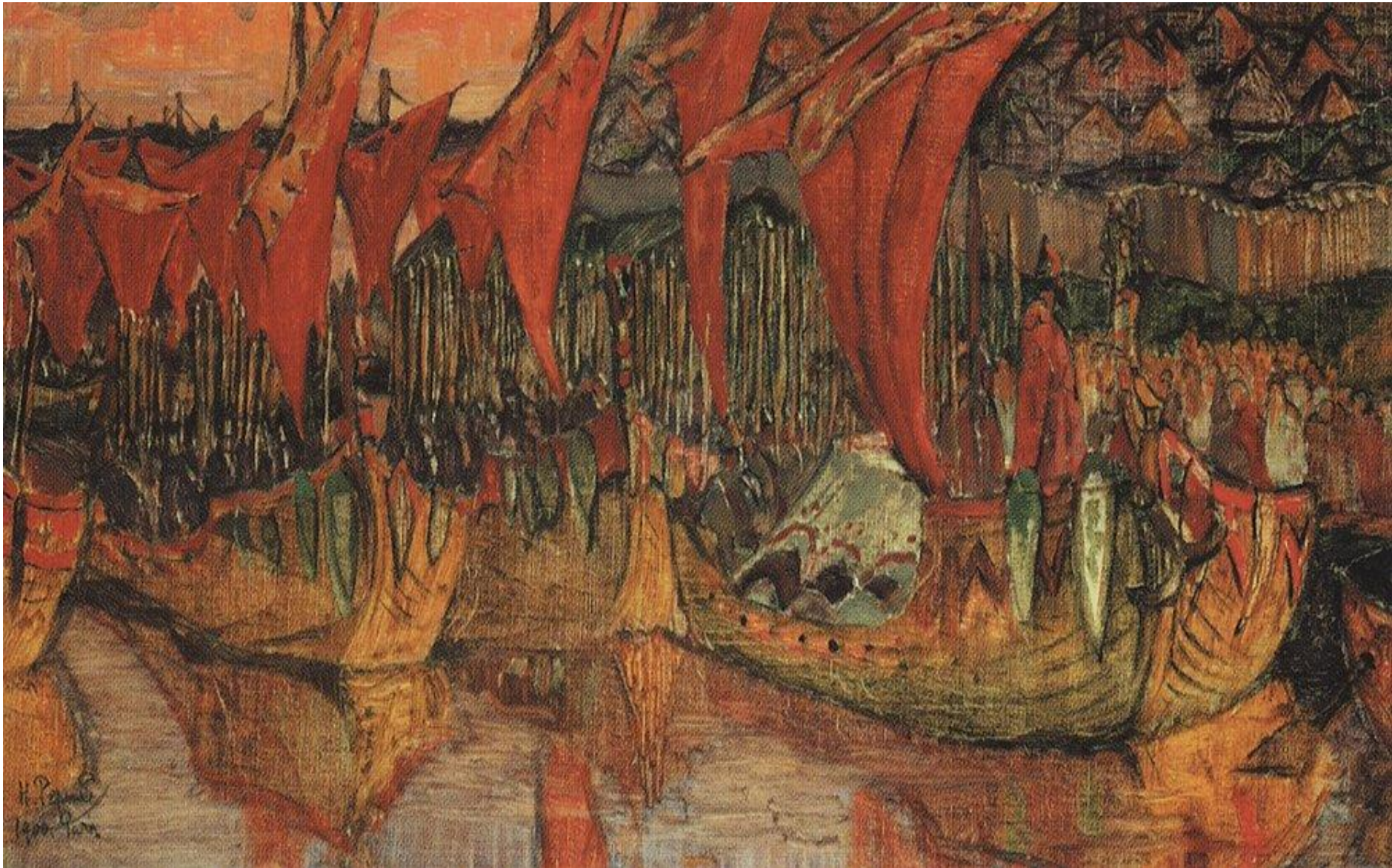
Поход Владимира на Корсунь. Н. Рерих, 1900 г.

«В 6496 (988) году пошёл Владимир с войском на Корсунь, город греческий, и затворились корсуняне в городе...»