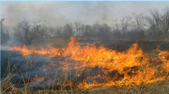
ВОЗГОРАНИЕ СУХОЙ РАСТИТЕЛЬНОСТИ

Прогнозируемые риски. Повышенная пожароопасность (4 класс)