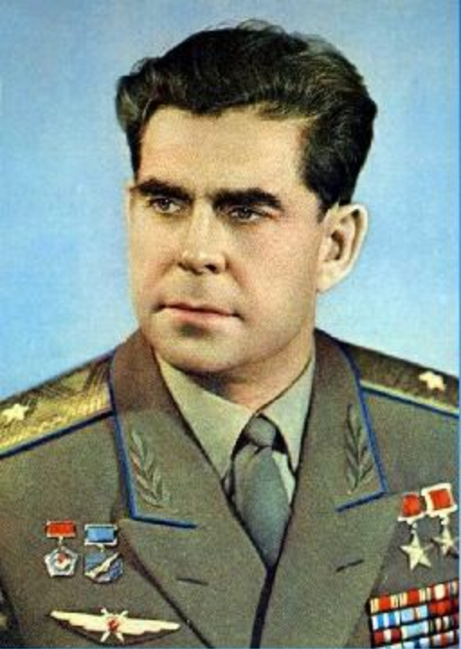
Георгий Береговой, космонавт (1921-1995)