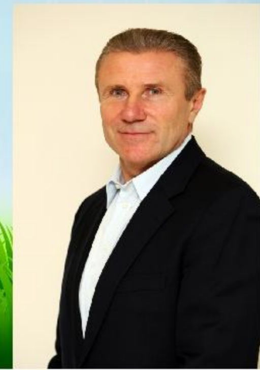
Сергей Бубка, спортсмен-легкоатлет (1963)