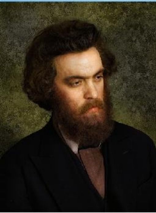
Архип Куинджи, художник (1842-1910)