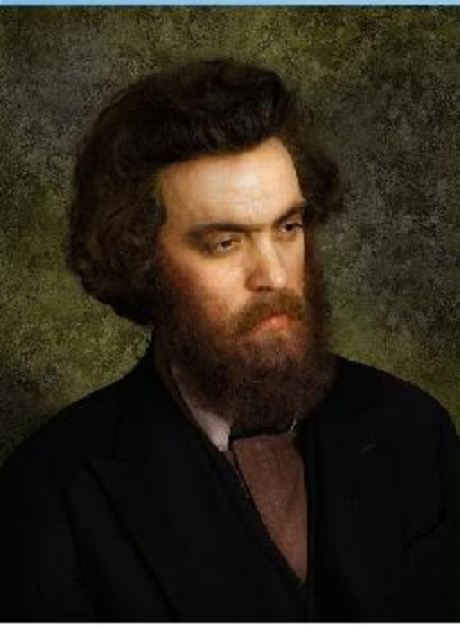
Архип Куинджи, художник (1842-1910)