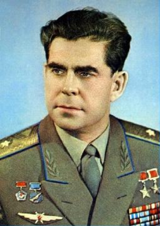
Георгий Береговой, космонавт (1921-1995)