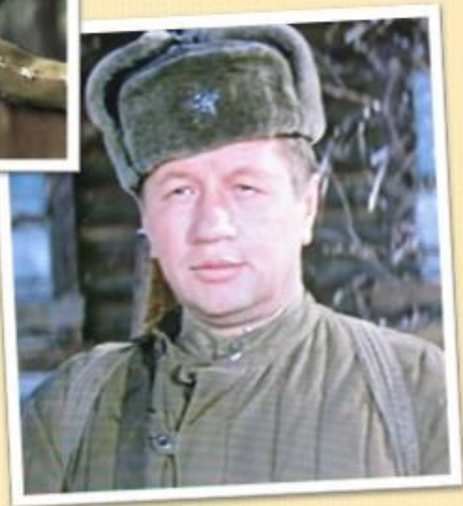
Леонид Быков (1928 -1979)

Советский актёр, кинорежиссёр и сценарист