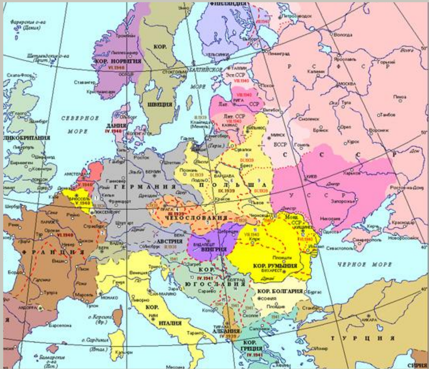
Политическая карта Европы в 1936 г.