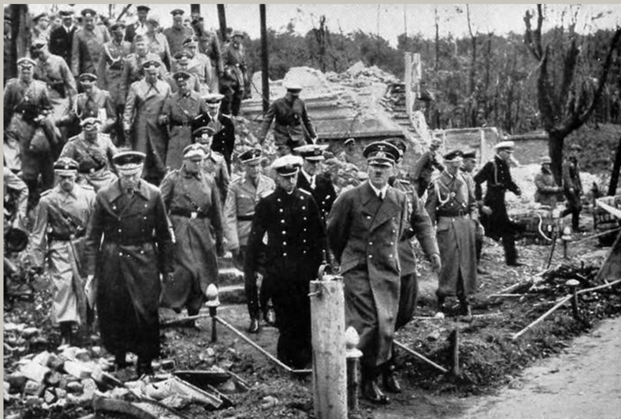
Адольф Гитлер на территории захваченной Польши.

Повод к войне – Гляйвицкий инцидент – захват группой немцев переодетых в польскую форму радиовышки в городе Гляйвиц (граница Германии с Польшей).