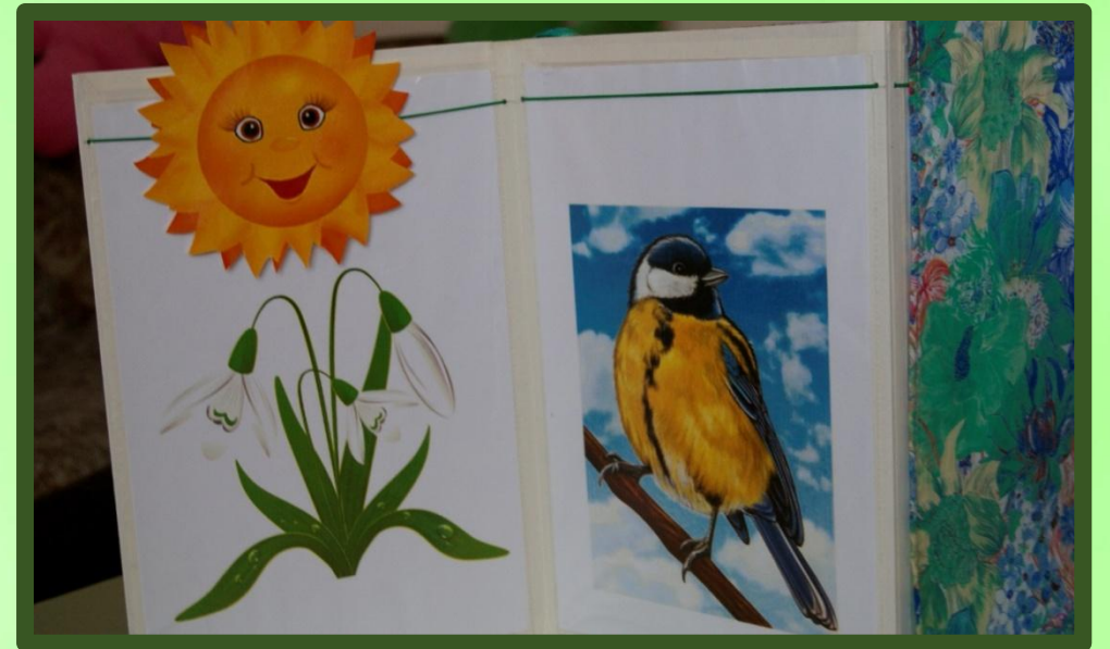
Пособие «Весенняя книга»