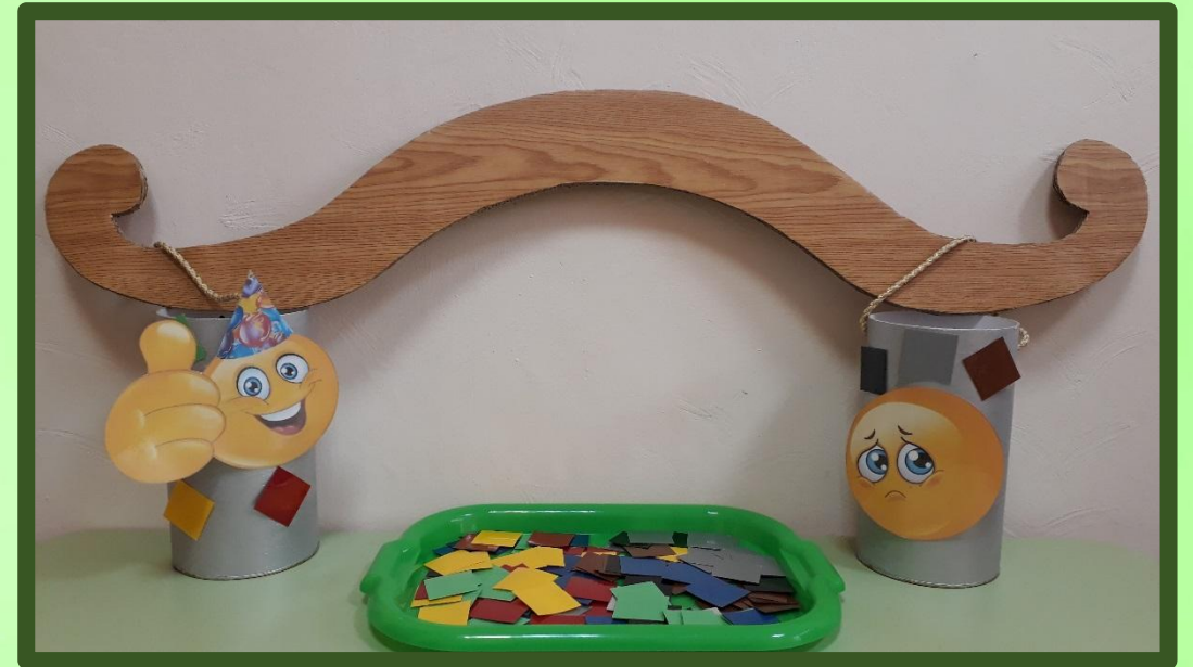
Игровое пособие «Цветное настроение»