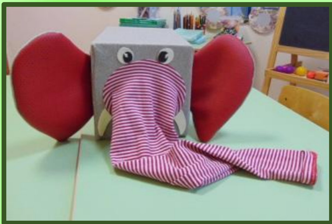
Игровое пособие «Озорной слонёнок»