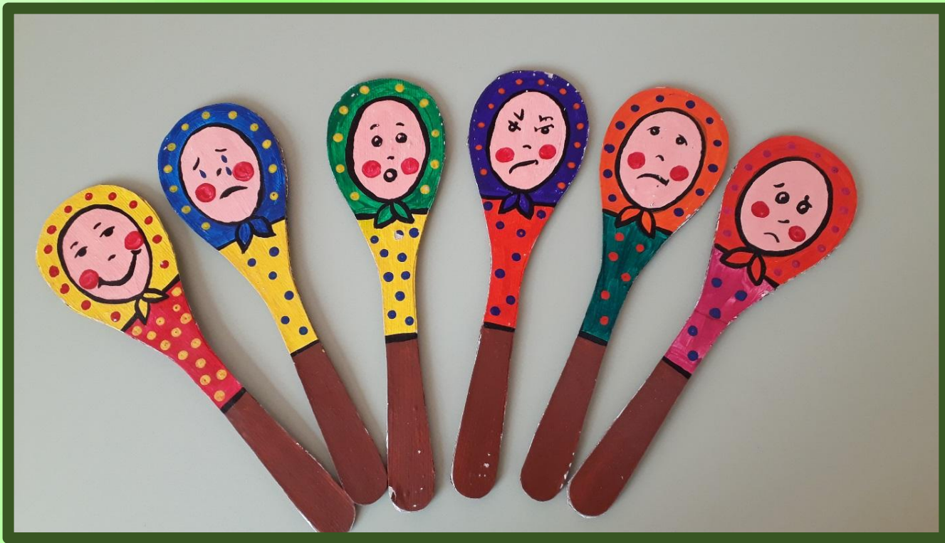
Игровое пособие «Эмоциональные ложки»