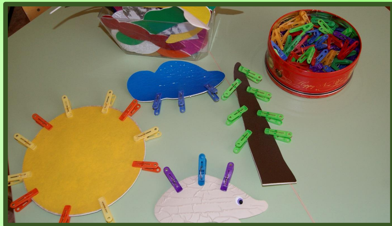
Игровое пособие «Забавные прищепки»