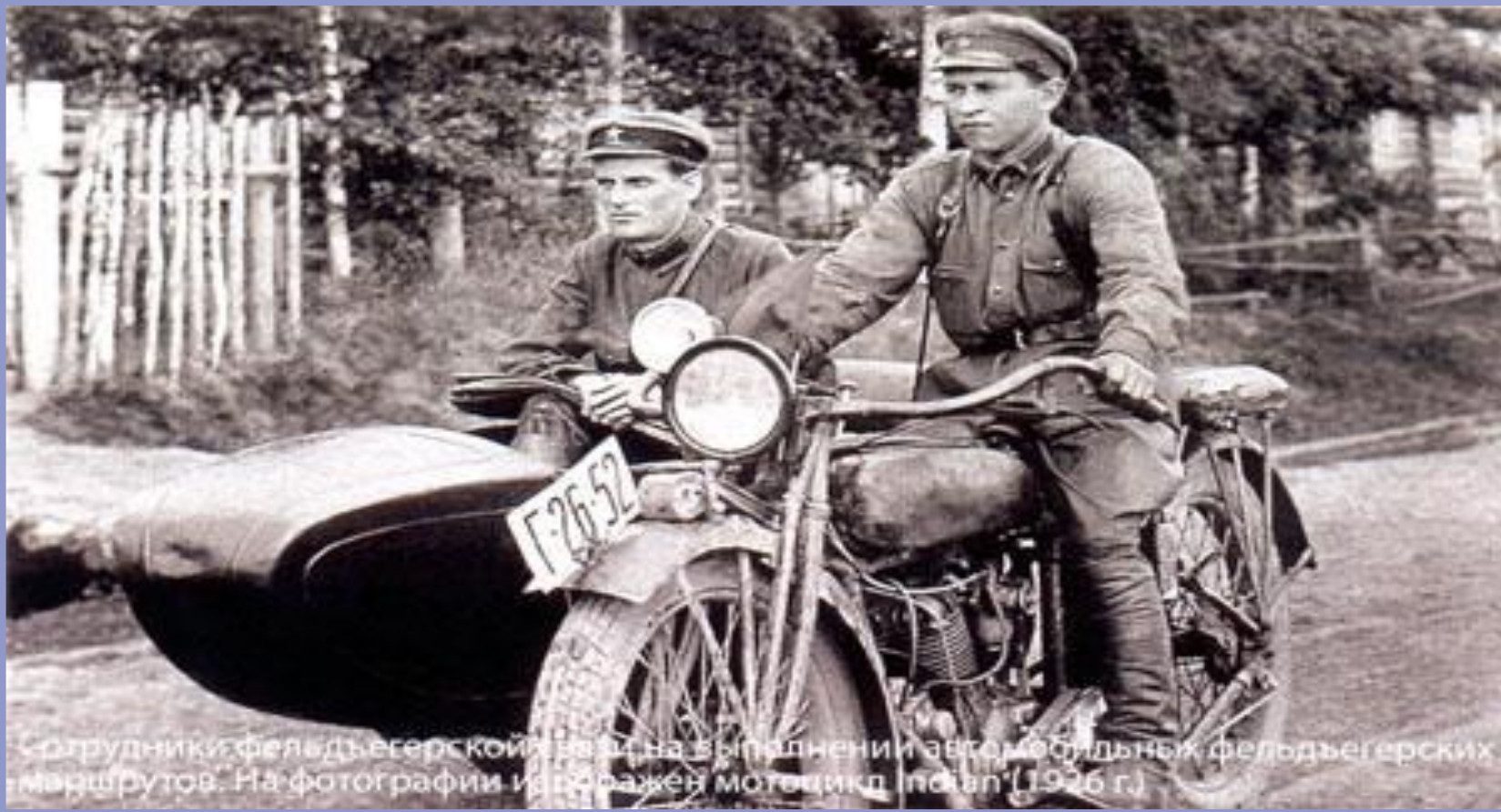
Сотрудники фельдъегерской связи на выполнении автомобильных фельдъегерских маршрутов. На фотографии изображен мотоцикл «Индия» (1926 г.)

* Параллельно со Службой внешней связи существовала и Военная команда самокатчиков Совнаркома, которая состояла из солдат самокатных батальонов прежней армии. Словом «самокат» сто лет назад в России называли велосипед. Эти курьеры передвигались на складных военных велосипедах конструкции француза Жирара.