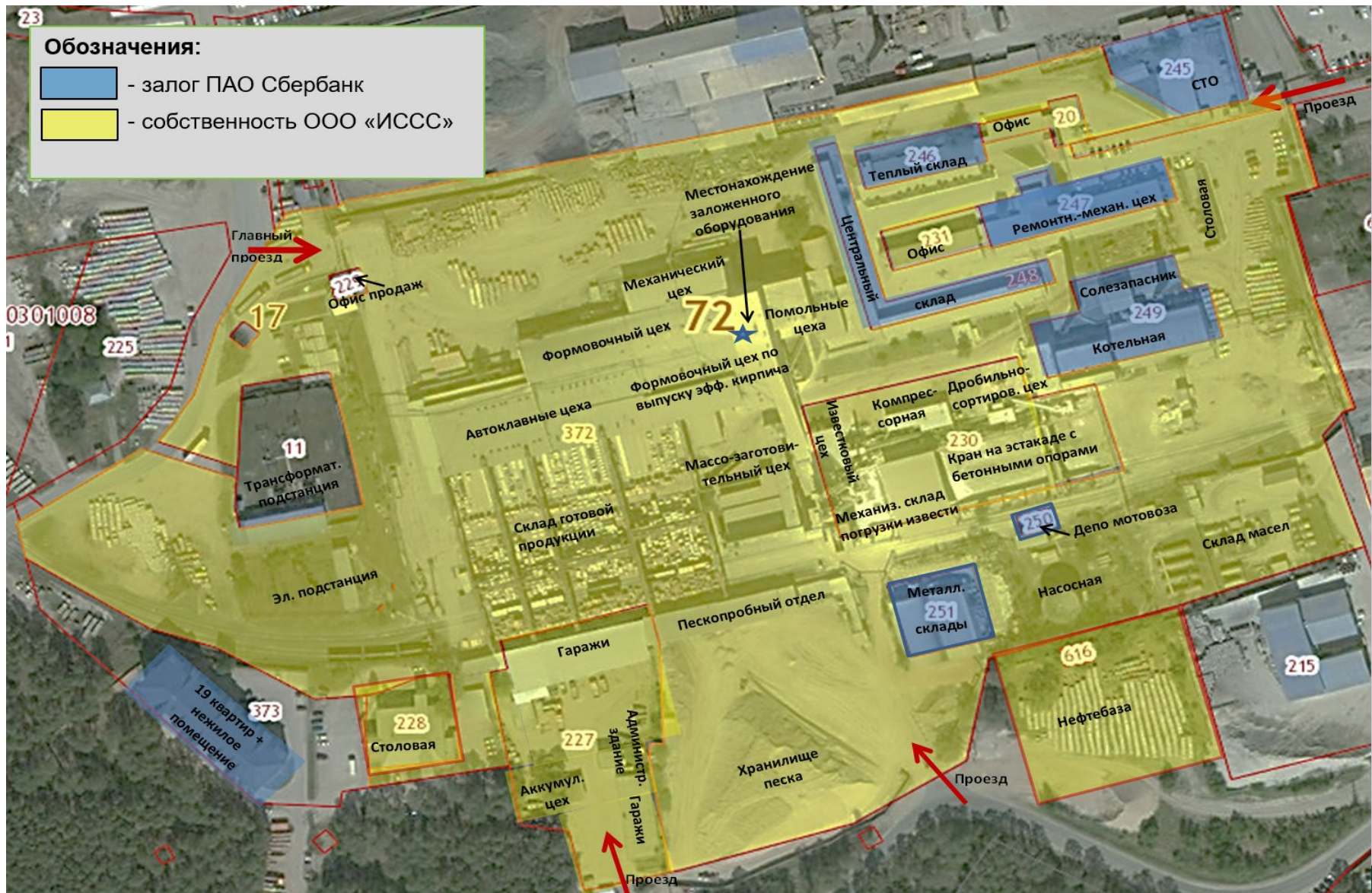
Схема завода силикатных изделий