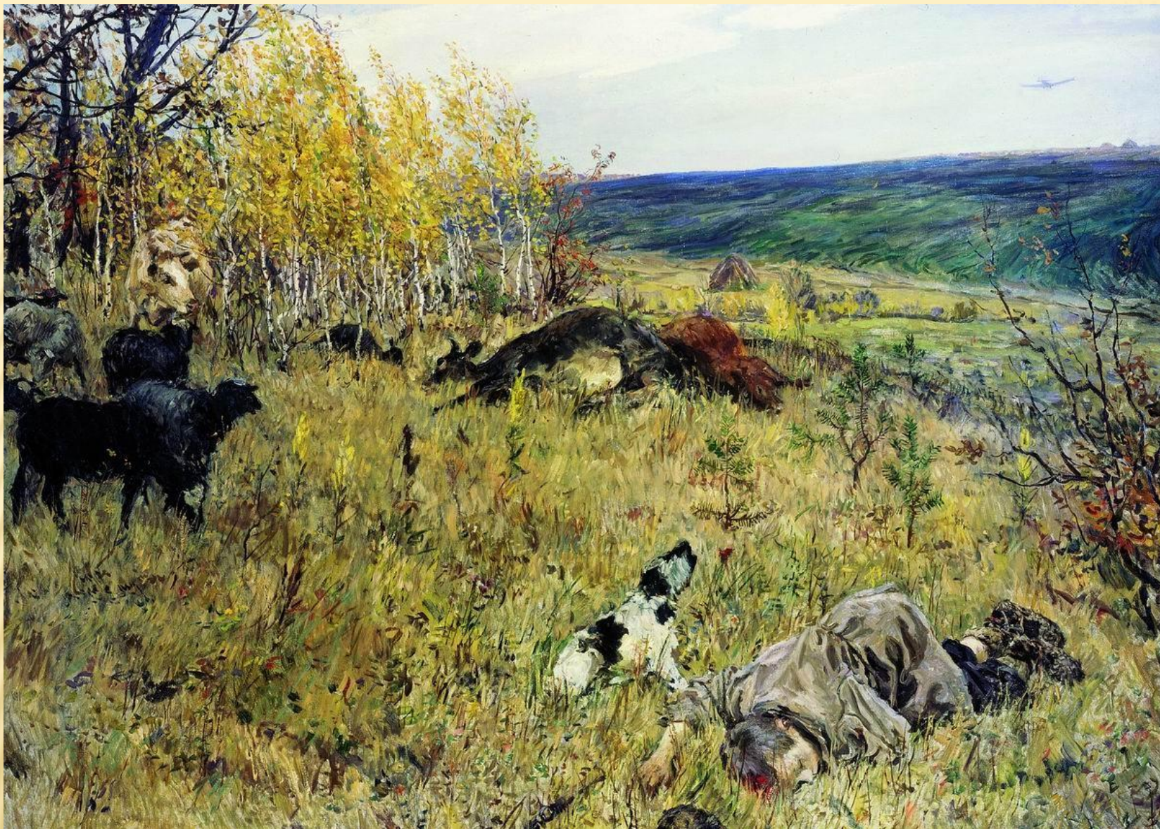
Аркадий Александрович Пластов «Фашист пролетел»