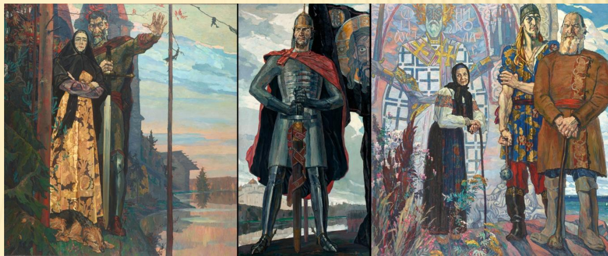
Павел Дмитриевич Корин Триптих «Александр Невский»