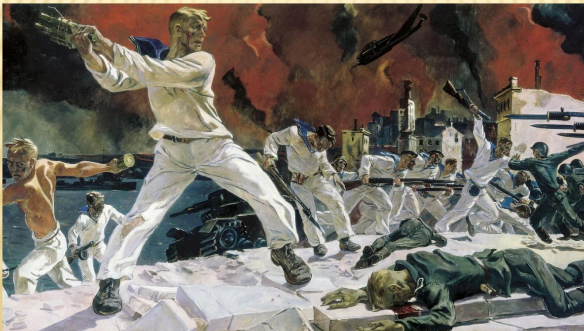
Александр Александрович Дейнека «Оборона Севастополя»