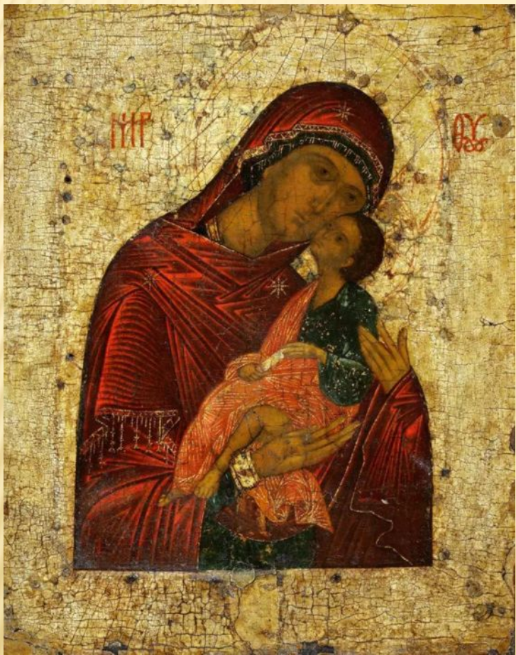
Андрей Рублев «Богородица Умиление Старорусская»