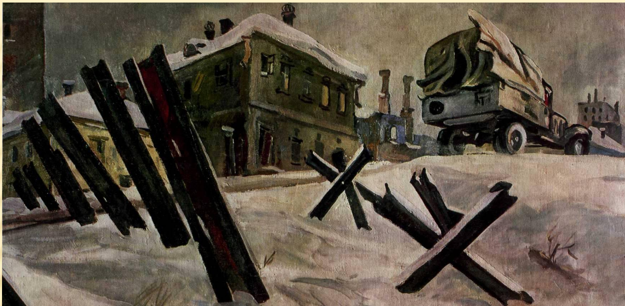
Александр Александрович Дейнека «Окраина Москвы. Ноябрь 1941 года»