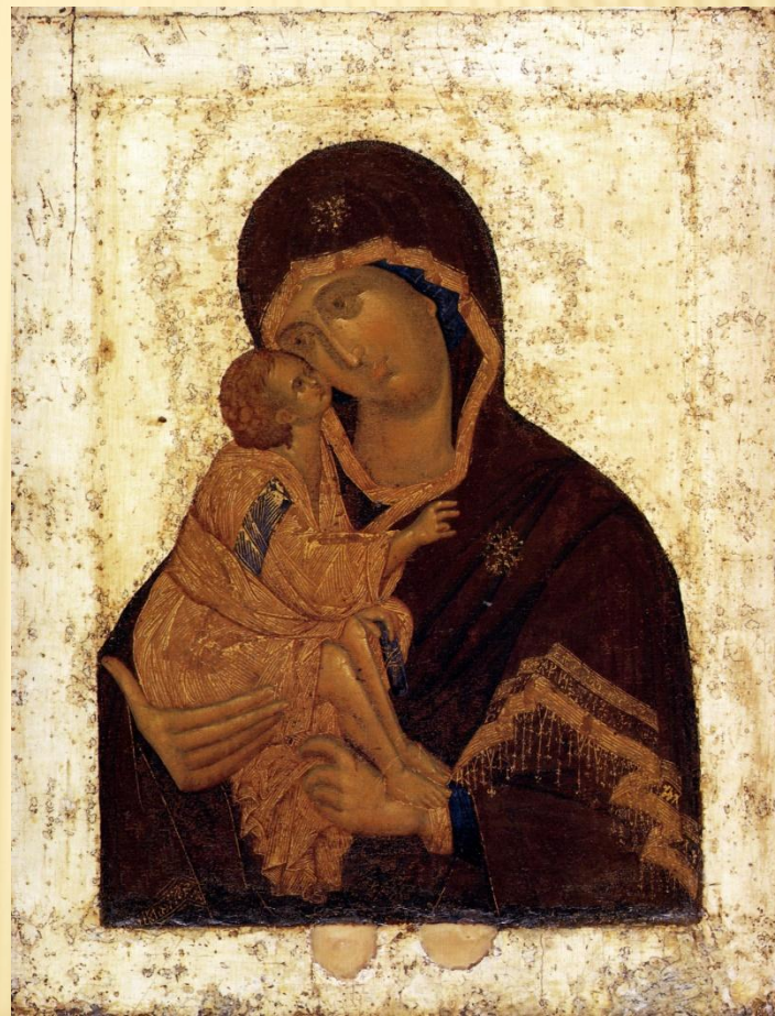
Феофан Грек «Богородица Донская»