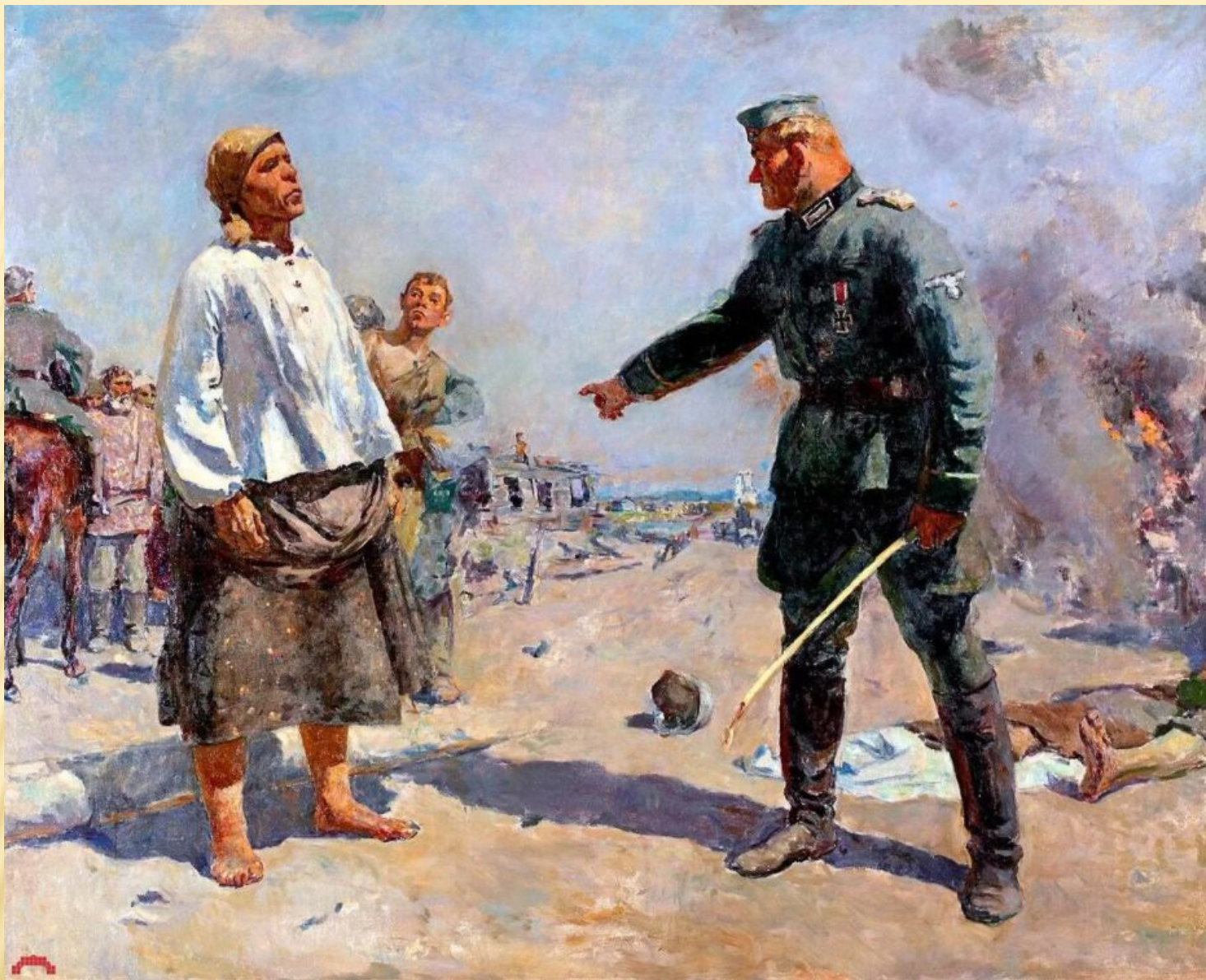
Сергей Васильевич Пластов « Мать партизана »