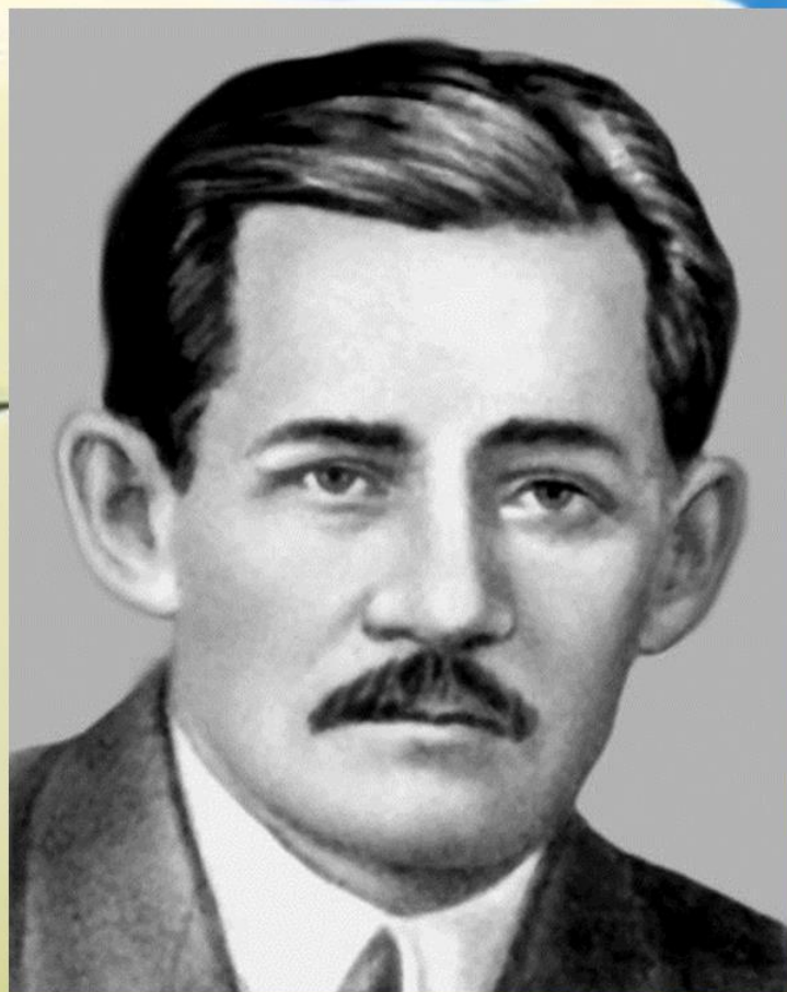
Мəжит Ғафури ( Абдулғафуров Ғабделмəжит Нургəни улы 20 июль 1880 йыл — 28 октябрь 1934 йыл )