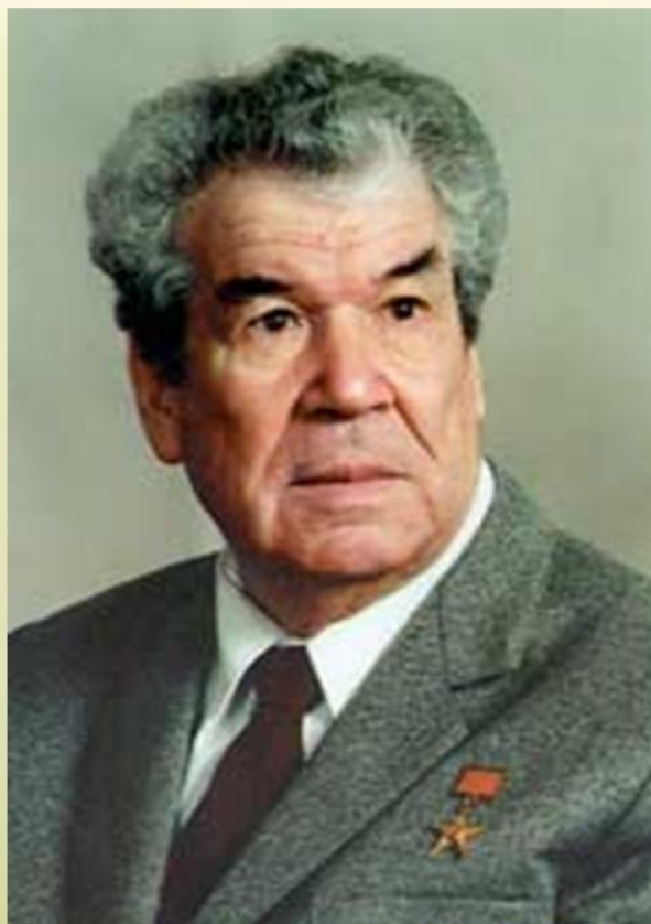
Мостай Кәрим (тулы исеме — Мостафа Сафа улы Кәримов ; 20 октябрь 1919 йыл — 21 сентябрь 2005 йыл )