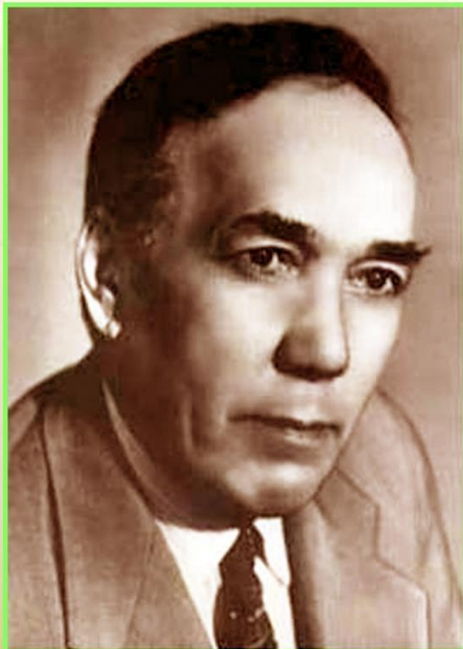
Сəйфи Кудаш Кудашев Сəйфетдин Фəттəхетдин улы ( 21 сентябрь 1894 йыл — 29 июнь 1993 йыл )