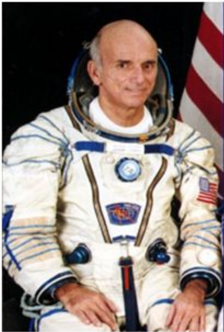
Первый космический турист Деннис Тито

В скором будущем, возможно, в космос можно будет полететь даже школьнику, изучающему планеты. А может быть там построят дома и гостиницы для Землян, и мы сможем побывать на разных планетах. Ведь столько ещё неизвестного, неизученного в бесконечном космическом пространстве Вселенной!