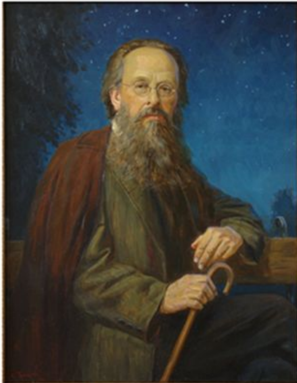
Циолковский Константин Эдуардович (1857 - 1935)

Выдающийся русский ученый и изобретатель Константин Циолковский разработал теорию межпланетных полетов и основы ракетостроения. Предложил использовать для ракет жидкое топливо, продумал устройство ракеты и вывел формулу движения ракеты.