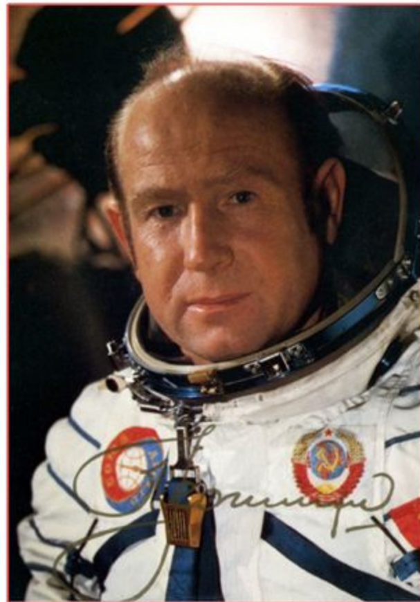
Космонавт Леонов Алексей Архипович

Общее время первого выхода составило 23 минуты 41 секунду (из них вне корабля 12 минут 9 секунд), и по его итогам был сделан вывод о возможности человека выполнять различные работы в открытом космосе.