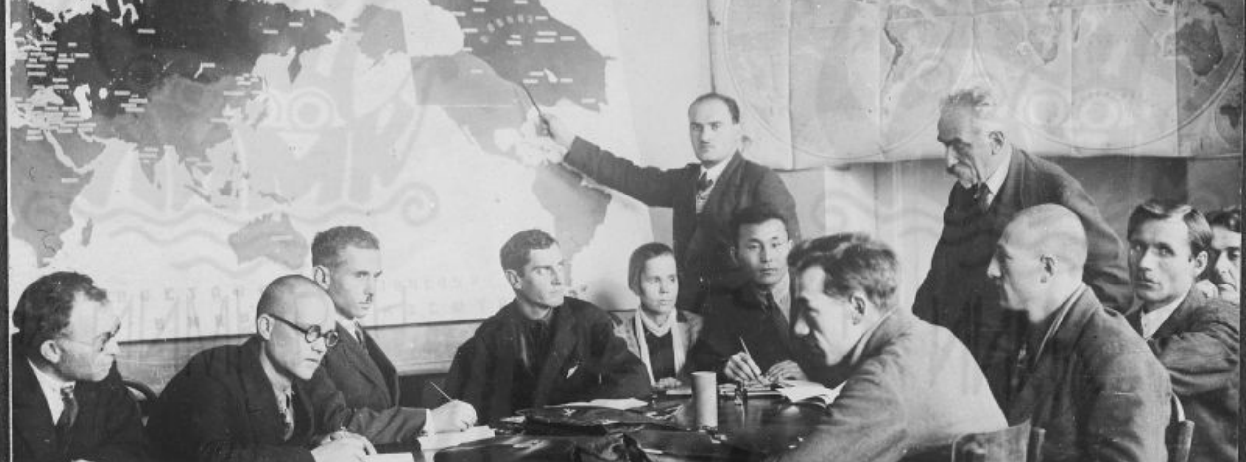
Н. Я МАРР НА ЗАНЯТИЯХ С АСПИРАНТАМИ ИНСТИТУТА ЯЗЫКА И МЫШЛЕНИЯ АКАДЕМИИ НАУК СССР, 1931 Г.