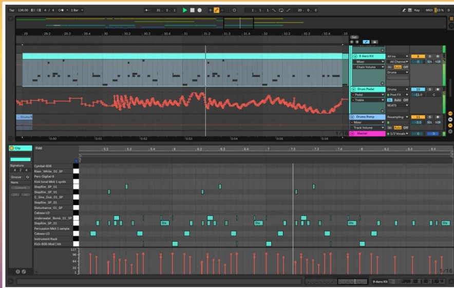
Ableton 10 live

Программное обеспечение ABLETON LIVE возникло примерно одновременно с FL STUDIO , но имело меньшие возможности. Сейчас же это полноценный программный комплекс для создания музыки и для живых выступлений, которым пользуются профессиональные артисты, композиторы, диджеи и аранжировщики