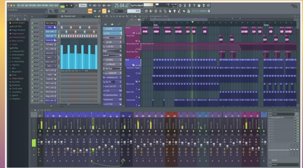
Fl studio 20