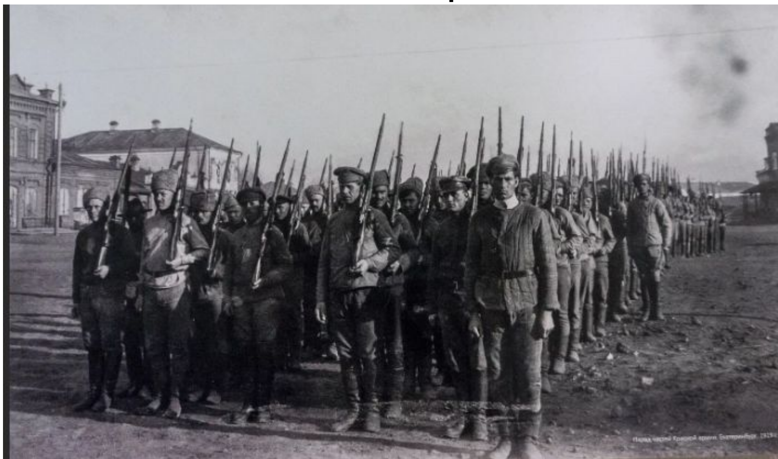
Часть Красной армии, Екатеринбург, 1918 г.