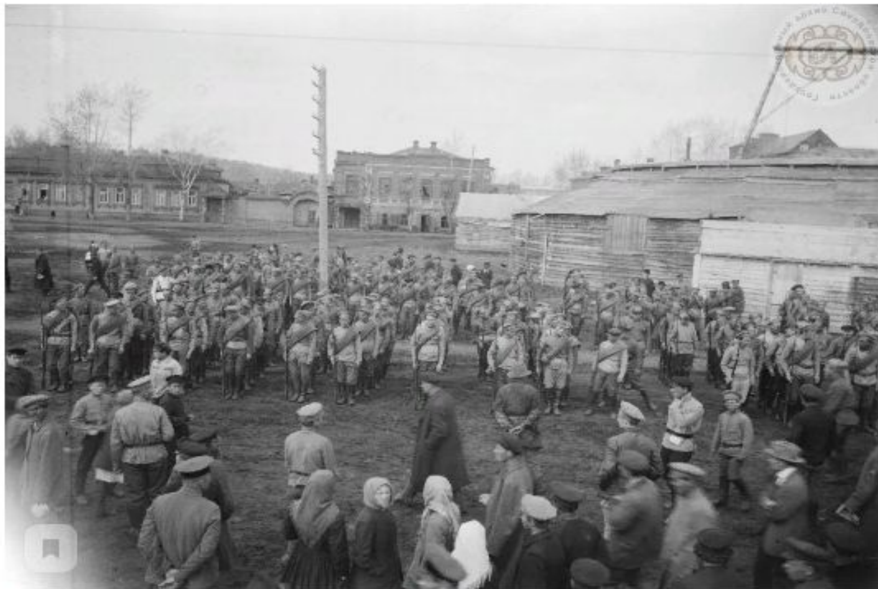
Подготовка к первому параду РККА в Екатеринбурге.