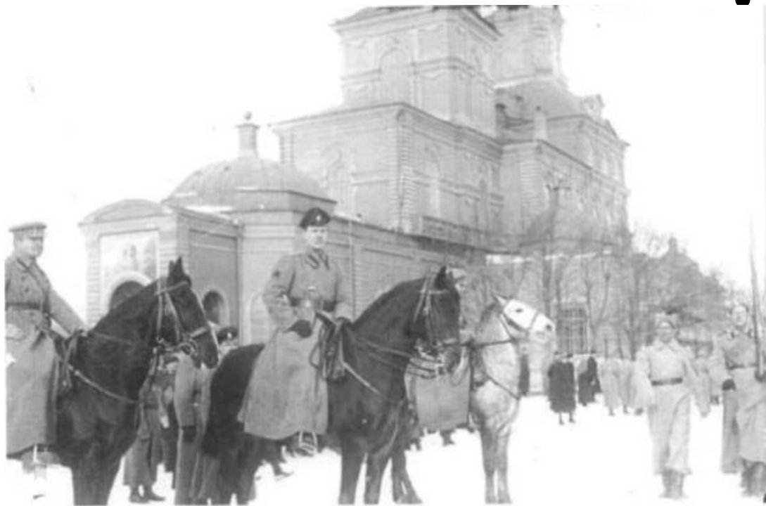
«Войцеховский принимает парад чехословацких войск на главной площади Екатеринбурга, начало 1919 года»