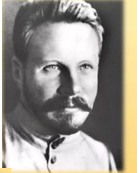
Михаил Васильевич ФРУНЗЕ