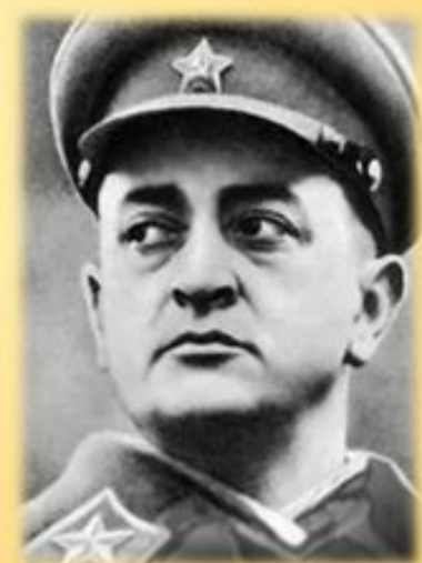
Михаил Николаевич ТУХАЧЕВСКИЙ